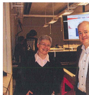
Professorerna Anne L'Huillier och Claes Göran Wahlström är glada över sitt för

Tillbyggnaden ses utifrån som en jordkulle intill huset. Även strålsäkerheten har förbättrats.