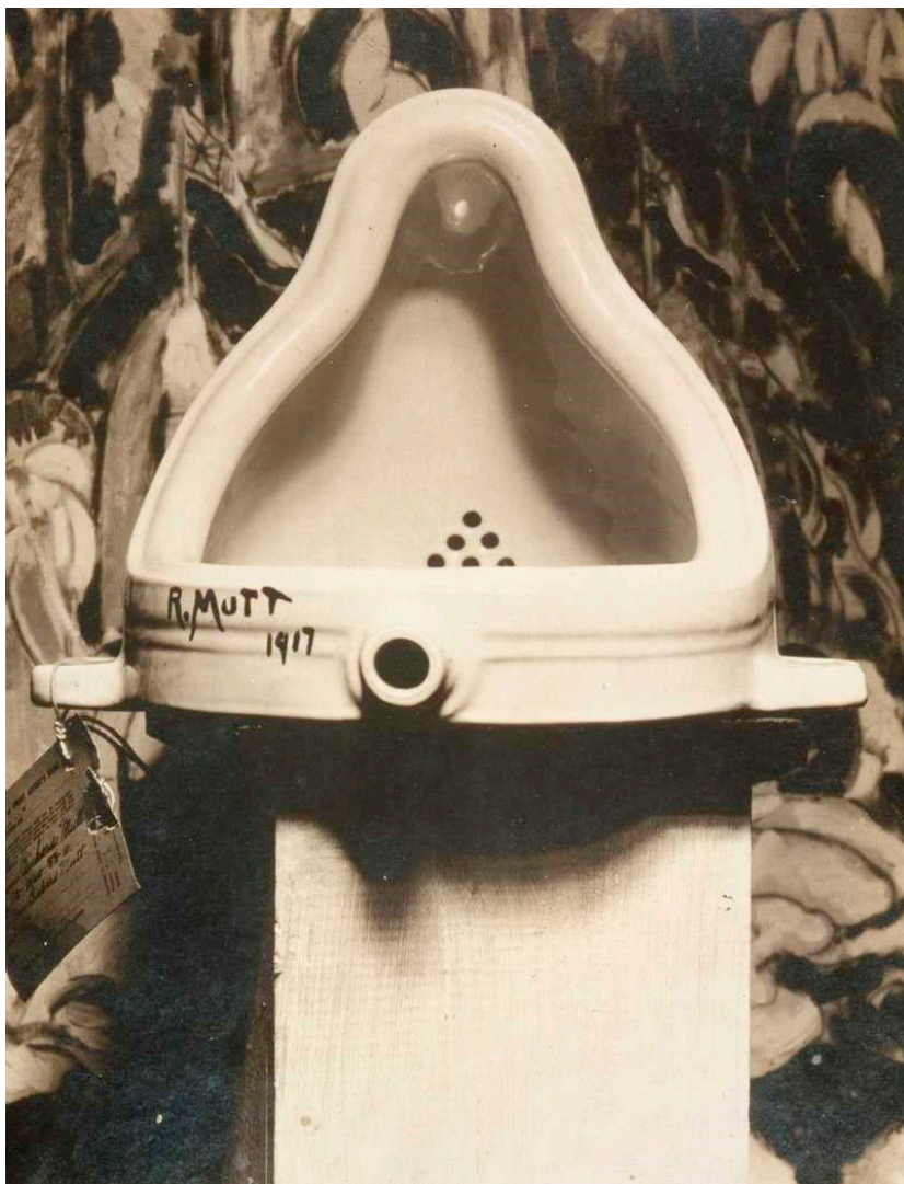
Fontän, skulptur signerad med pseudonymen R. Mutt, 1917.