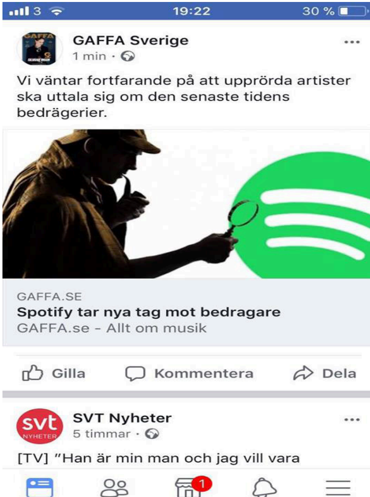
Fig. 2. Skärmdump, inlägg på tidningen Gaffa :s Facebooksida, som visar bild och länk till artikel om Spotify (10.3.2018).

på Baker Street 221 B, och grubblar på något av alla de fall som han har råkat dras in i. Att analysera exempel som dessa handlar om att dels identifiera och kategorisera de olika mediala egenskaperna, dels analysera hur mening produceras via de samverkande medierna.