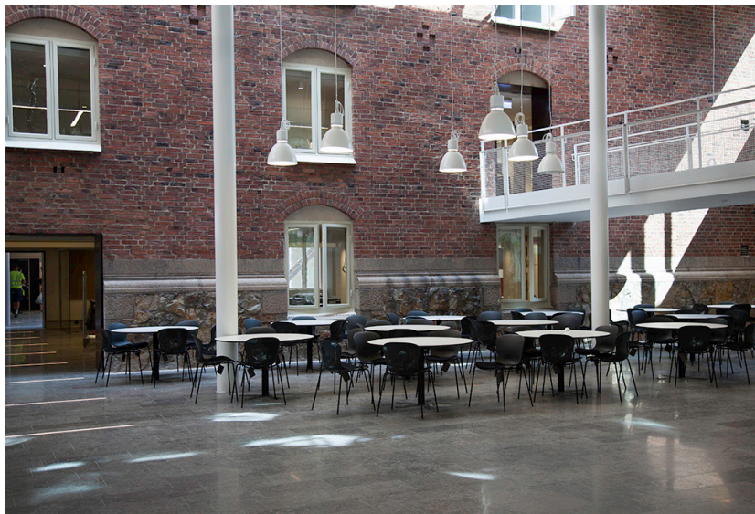
Inflyttning i LUX. den 12 augusti 2014.