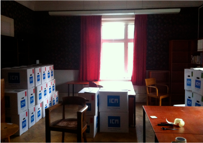
Uppbrott från Finngatan 10. Foto Lynn Åkesson den 17 juni 2014.