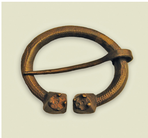
Figur 4. Ringspännet från Hemlingby, Valbo socken, Gästrikland. Spännets diameter är 6 cm. Ringspännet påträffades i en grav tillhörande en kvinna. Graven, en båtbrandgrav, innehöll ett stort antal föremål däribland östersjöfinsk keramik.

graven; två förgyllda ovala spännbucklor (P51), ett förgyllt treflikigt spänne, ett till hänge omgjort orientaliskt