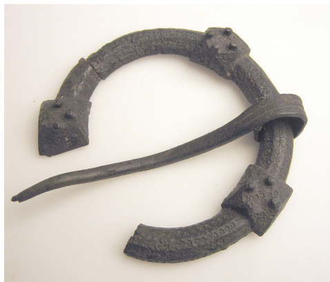
Figur 1. Ringspänne med piggförседda och facetterade knoppar. En knapp saknas. Spännets diameter uppgår till 6,5 cm. Ringspännet kommer från en grav i Birka som efter utgrävaren Alexander Seton benämns Seton grav VI.

nena även förekommer på andra föremål vars geografiska tyngdpunkt återfinns inom dagens finska område. 5