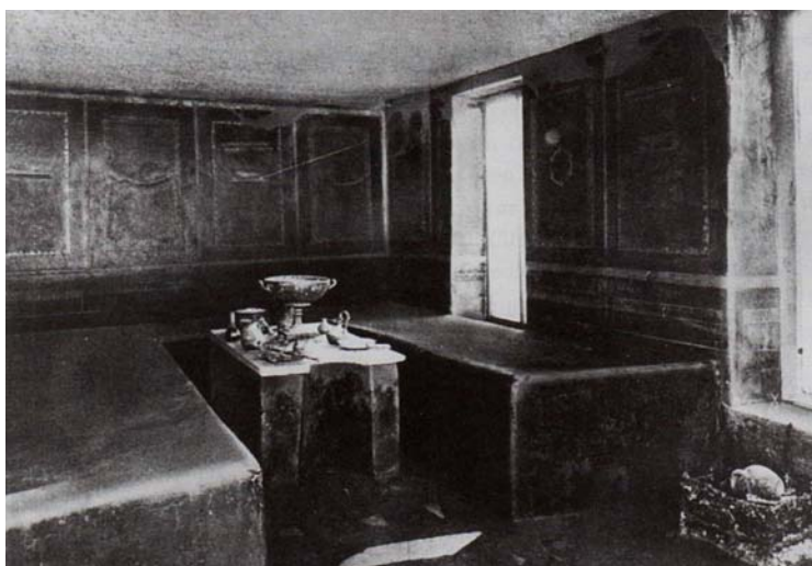
Fig. 1 – Pompeii, sommartriclinium. Efter Dunbabin 2003, fig. 18.

Den romerska världen kände inte till modern punktlighet; gästerna anlände med stora mellanrum och förseningar förefaller inte ha varit ett irritationsmoment. Antalet inbjudna varierade, men åtskilliga romerska källor refererar till att det rörde sig allt från sex till nio vid en idealiskt fullbemannad bankett. Vid ingången hade gästernas skor ( calcei ) avlägsnats, fötterna tvättats, varefter varje gäst fick soleae , ett slags innetofflor. De välkomnades samt aviserades av nomenclator , varefter gästerna leddes till sina platser. Convivium arrangerades i hemmets matsal, triclinium (fig. 1).