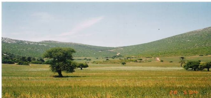
Fig. 2. Ett attiskt jordbrukslandskap.