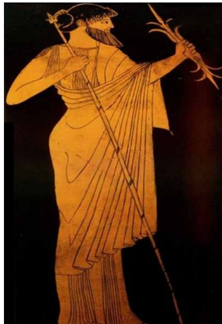
Fig. 1. Zeus håller i blixten och spiran.

Zeus framställs ofta som en del av händelsernas orsakskedja. Han är den långtseende Olympier, härskaren, gudarna och människornas far men det som utmärker honom är att han är gud över himmel, väder, storm, blixn och åska. En mängd olika myter har skapats kring denna gudomlighet och alla Olympens gudar har någon form av samband med Zeus. Han firas i många olika städer och tempel samt altare har höjts åt hans tillbedjan över många delar av världen. Det finns oändliga bilder av Zeus med en blixn i handen, men han kopplas också till örnen, fåglarnas herre, och spiran som ger makt åt mänskliga härskare.