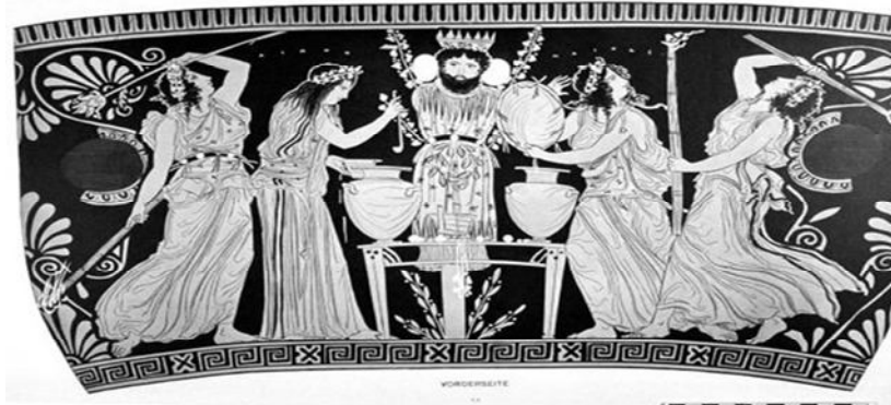
Fig. 4. Dionysos i mitten tillsammans med sina kvinnliga tillbedjare.

som han hade velat. Stadens kung Pentheus vägrar att ta emot denna främling från öst och dessutom förnekar Semeles tre systrar; Ina Autonoe och Agaue att Dionysos verkligen är son till Zeus. Som hämnd för allt detta driver Dionysos stadens kvinnor till vansinne och lockar dem att lämna sina hem för att tillbe honom. I all denna kaos får han Agaue att slita sin son i stycken i en våldsorgie. 11