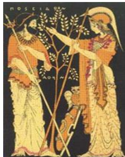
Fig. 6. Athena och Poseidon i tävling.

Poseidon slog fram en källa med havsvatten med sin treudd ur en bar klippa i Akropolis. Denna visade sig vara värdelös eftersom det var saltvatten. Athena producerade då omedelbart den gåvan som vann de flesta rösterna bland olympens gudar. Från marken lät hon växa upp ett träd med gråa löv och smala ovala frukter. Det var ett uppodlat olivträd som var mycket mer värdefullt och ekonomiskt användbar än en vattenkälla. På så sätt fick staden sitt nuvarande namn och beskyddare. 14