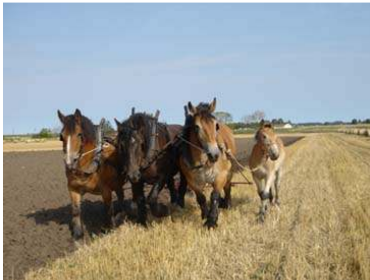
Plöjning på gammaldags vis i VikingaTider (VikingaTiders hemsida).

Under 2005 års marknad i VikingaTider ordnades aktiviteter såsom barnens fornverkstad där en arkeolog berättade om arkeologiskt material och vad materialet kan berätta om vikingatiden och forntiden, barnen fick också tillverka olika föremål av ben, skinn och horn. Andra aktiviteter var sagoberättande och musikunderhållning. Besökarna fick även lära sig om forntida instrument, repslagning, salttillverkning, ölbrygging, bronsgjutning, växtfärgning och smide. Kämpar och bågskyttar visade upp sig och besökaren kunde prova på spjut och båge. Marknadsbesökaren kunde också uppleva tidsresan genom att se tre ardennerhästar som plöjde en åker på gammaldags vis. Man kunde även besöka VikingaTiders egen häxa och sejdman för att få råd och bot (VikingaTiders hemsida).