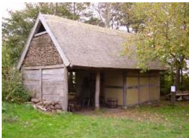
Aktivitetshuset i VikingaTider

I VikingaTider finns för närvarande tre rekonstruerade vikingatida hus, ett långhus, ett grophus och ett aktivitetshus, men många fler är planerade: en kulturborg med vikingatida exteriör och modern interiör innehållande restaurang, butik, utställningshall, verkstäder, hotellanläggning med 24 rum, konferensutrymmen och auditorium samt ett osteologiskt centrum. Dessutom har man planer på att återskapa två stora vikingatida gårdar med tillhörande betesmarker och begravningsplats. En kvarn, en stavkyrka, en marknadsplats och ett båtvarv kommer också att ingå i vikingabyn. En liten konstgjord sjö är redan anlagd på den 25 hektar stora marken. Allt kommer att vara handikappanpassat och toaletter och andra bekvämligheter kommer att finnas på området (Jonson, muntlig uppgift).