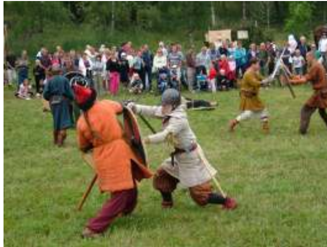
Utländska vikingakämpar på Fibulas marknad 2006.

Det andra jag ville ta reda på i min problemställning är vad kan man tillföra helt nytt till konceptet med hjälp av andra vikingabyars idéer.