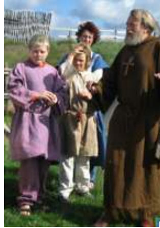
Guidning i vikingareservatet, Foteviken.

Det är bra att barnen får vara med och tillreda maten de ska äta, så kallad ”learning by doing”. Detta hoppas jag att Fibula också använder i sitt lägerskolskoncept. En idé skulle vara att dela upp deltagarna i mindre grupper, en för matlagning, en för dukning och en för avdukning och diskning och sedan byter grupperna uppgifter vid nästa måltid.