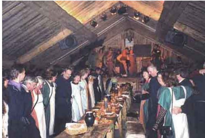
Gästabud i Valhall december 2000 (Dahlberg 2000).

mat och underhållning endast för re-enactors (Dahlberg 2000; Fotevikens Museums hemsida). Under Midvinterblotet blir vikingarna indelade i mindre grupper och dessa ska sedan tävla mot varandra i olika tävlingar såsom äppelklyvning med svärd, rövkrok och bågskytte, allt sker inne i Valhall (Dahlberg 2000).