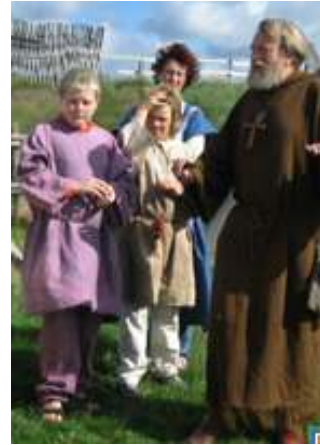
Guidning i vikingareservatet, Foteviken.

en gång. Detta kan man göra som i Fotevikens vikingareservat med en rundvandring tillsammans med en byinvånare.