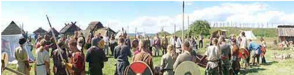
Vikingakämpar på träningsläger i Foteviken 2001 (Fotevikens Museums hemsida).

Fotevikens byalag ordnar varje år en träningshelg för vikingakämpar där bågskytte och fighting tränas. Fotevikens Museum har vikingakamp som en programpunkt under deras sommarmarknad där re-enactors visar olika stridstekniker som kan ha använts under vikingatiden (Fotevikens Museums hemsida).