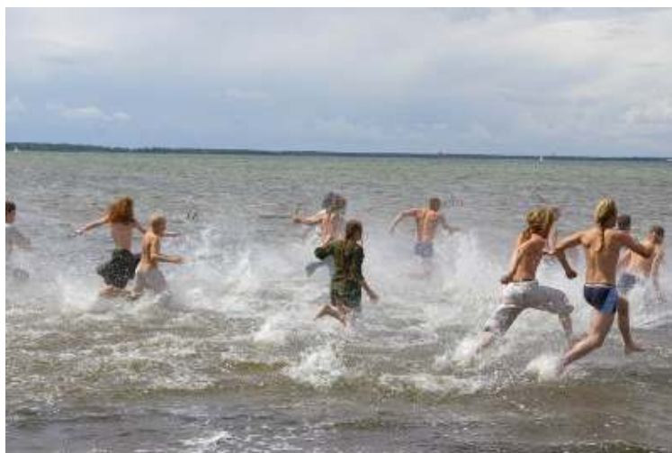
Vikingaruset vid Foteviken.

”Vikingaruset” är ett uppskattat inslag i marknaden i Foteviken. Vikingaruset är en tävling som går ut på att deltagarna löpande i knädjupt vatten ska runda två vikingaskepp placerade 50 meter från Höllvikens strand. Först tillbaka vinner. Alla knep är tillåtna för att hindra sina motståndare men man måste bära på minst ett föremål med vikingatida tradition (Foteviken film; Rosborn 2005, s. 86).