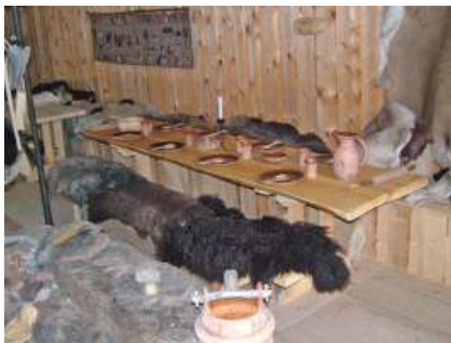
Inne i Fibulas långhus (Fornföreningen Fibulas hemsida).