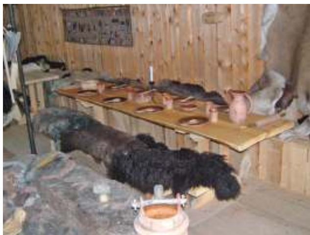
Inne i Fibulas långhus (Fornföreningen Fibulas hemsida).