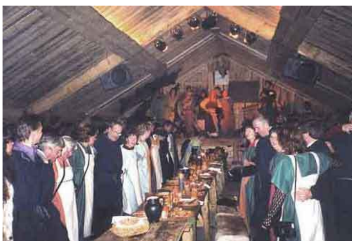
Gästabud i Valhall december 2000 (Dahlberg 2000).

vikingastil med träväggar, träbord och träbänkar. Sven Rosborn berättade att Sven Melander hade gästade Foteviken och stått för underhållningen på scenen sommaren 2007 under ett gästabud, vilket hade varit väldigt lyckat (Rosborn, muntlig uppgift). Under gästabuden bjuder Fotevikens vikingareservat på underhållning och mat och ett av deras största och mest uppskattade gästabud är Midvinterblotet, ett annorlunda julbord med vikingatidsinspirerad mat och underhållning endast för re-enactors (Dahlberg 2000; Fotevikens Museums hemsida). Under Midvinterblotet blir vikingarna indelade i mindre grupper och dessa ska sedan tävla mot varandra i olika tävlingar såsom äppelklyvning med svärd, rövkrok och bågskytte, allt sker inne i Valhall (Dahlberg 2000).