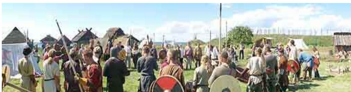
Vikingakämpare på träningsläger i Foteviken 2001 (Fotevikens Museums hemsida).

Fotevikens byalag ordnar varje år en träningshelg för vikingakämpare där bågskytte och fighting tränas. Fotevikens Museum har vikingakamp som en programpunkt under deras sommarmarknad där re-enactors visar olika stridstekniker som kan ha använts under vikingatiden (Fotevikens Museums hemsida).