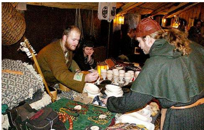
Marknadsstånd under vintermarknaden i Foteviken (Fotevikens Museums hemsida).