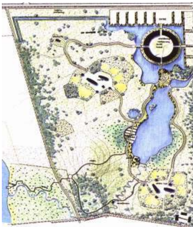
Plan över hur VikingaTider kommer att se ut när vikingabyn är klar (VikingaTiders hemsida).