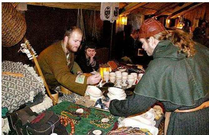
Marknadsstånd under vintermarknaden i Foteviken (Fotevikens Museums hemsida).