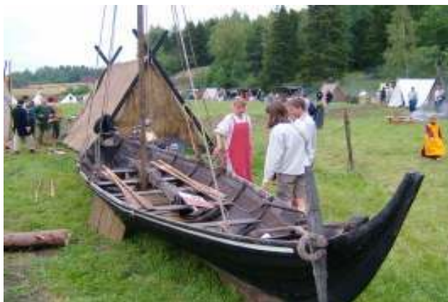
Visning av vikingaskepp under marknaden 2006.

vikingarus, d.v.s. de tävlande skulle runda markeringar ute i vattnet och den som kommer tillbaka först vinner.