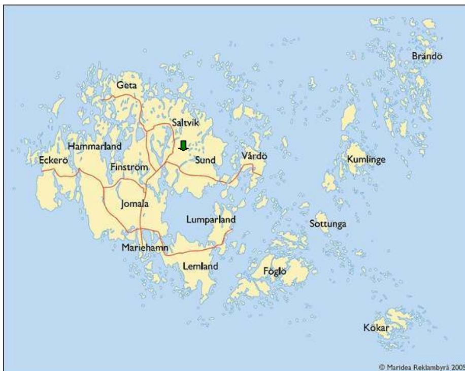
Karta över Åland. Den gröna pilen = Kvarnbo i Saltviks kommun.

Mitt ämne i denna uppsats är hur man kan utveckla ett redan befintligt koncept i en vikingaby och hur man även kan tillämpa ett nytt på den befintliga vikingaby. Jag kommer att utgå från Fornföreningen Fibulas vikingaby i Kvarnbo i Saltviks kommun på Åland och hur man skulle kunna utveckla deras koncept samt tillföra nya idéer. Fornföreningen Fibula bildades år 2003 och sedan dess har föreningen hunnit utföra ganska mycket. Med hjälp av det populära förmedlingssättet vikingamarknad har föreningen lockat fram många ålänningars intresse för vikingatiden och för historia och arkeologi. Mitt intresse för arkeologisk förmedling och fornbyar har växt fram under mitt första år som arkeologistuderande i Lund. I och med min b-uppsats Att lära sig om sin historia gör skolbarn starka! En undersökning om hur man kan förmedla arkeologi till skolbarn på Åland som jag skrev under vårterminen 2007, hade jag kontakt med Fornföreningen Fibula. När jag var på Åland under sommaren 2007 blev jag kontaktad av en medlem i föreningen med en förfrågan om jag kunde tänka mig att fundera på hur man kan utveckla Fibulas koncept och tillföra nya idéer och jag antog utmaningen. Jag är själv ålänning och Ålands arkeologi och forntid samt förmedlingen av denna är något som jag vill lära mig mer om och utveckla.