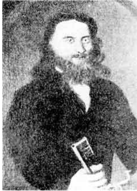
Fig. 1. Klockare avbildad med kyrkonyckeln i hand. 1600/1700- tal.

När valet av klockare var avklarat skulle klockaren enligt landskapslagarna få nycklarna till sockenkyrkan (fig. 1). 14 Wentz framhåller att nycklarna skulle kunna symbolisera kyrkan på något speciellt sätt och även vilket stort förtroende det låg i klockarens uppgifter. 15