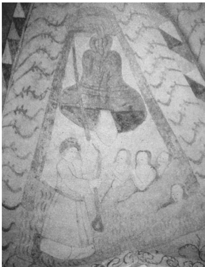
Fig. 3. Avlidna tar emot en själarینگning. Kalkmålning från Hattula kyrka i Finland.

Tyvär har jag varken hittat uppgifter angående dateringen eller om det verkligen är just en klockare som ringer.