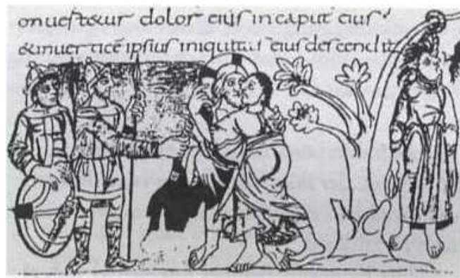
Fig. nr. 1. Judaskyssen och Judas död avbildad i Stuttgarterpsaltaren från 820-830.

Biblar och psaltare försågs emellanåt med illustrationer som kunde fungera som förlagor åt andra böcker eller bilder. T.ex. finns Judaskyssen och Judas död avbildad i Stuttgarterpsaltaren från 820-830, se fig. nr. 1.