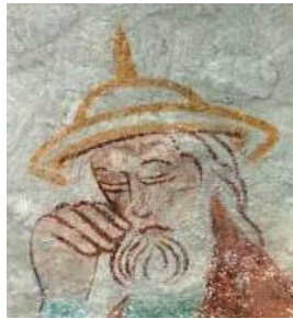
Fig. nr. 10. Josef, Skibby, Roskilde 1350.