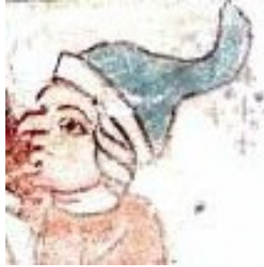
Fig. nr. 7. Törnekröningen Hemse, Gotland ca 1300.