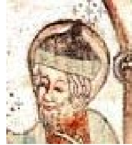
Fig. nr. 8. Josef, Jesu födelse, Hemse, Gotland mitten av 1400-tal.