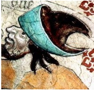
Fig. nr. 6. Kain, Härkeberga, Uppland 1480-tal.

Judehatten fanns i olika former och utföranden, se fig. nr. 6-10 och 12.