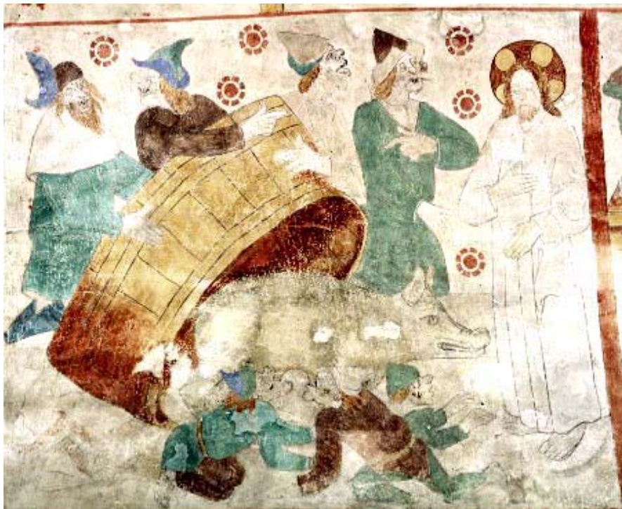
Fig. nr. 14. Judesuggan, Husby-Sjutolft, Uppland 1480-tal.

sugga som dias av några små män, några större män håller ett uppochnedvänt kar ovanför suggan och för samtal med Kristus, som har gloria medan de andra har judehatt. En skillnad mellan bilderna är att de är spegelvända mot varandra. Nilsén beskriver bilden i Husby-Sjutolft och menar att männen i judehattar är ”klart karakteriserade som judar” och att suggan har ett ”vällustigt uttryck” där den blir diad av två judar och en tredje fångar upp en stråle urin från hennes bakdel och en fjärde krälar framför henne, se fig. nr. 14 70 .