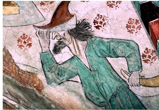
Fig. nr. 5. Kain, Härnevi, Uppland 1480-tal.

De gammaltestamentliga kvinnorna har inte försetts med judiska attribut, vilket är förvånande. Kanske var det så att judinnor inte uppfattades som så främmande som deras män. Troligtvis var de medeltida judinnornas plats i hemmet, varför målarna inte hade märkt speciella attribut att förse kvinnorna med i bilderna.