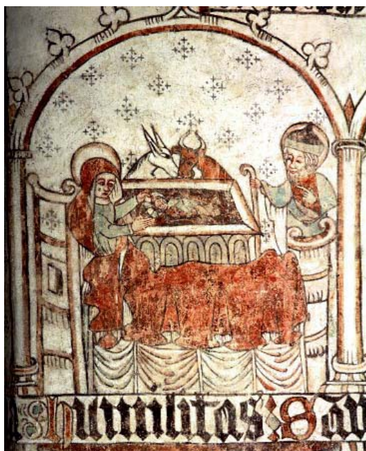
Fig. nr. 16. Jesu födelse, Hemse, Gotland mitten av 1400-talet.