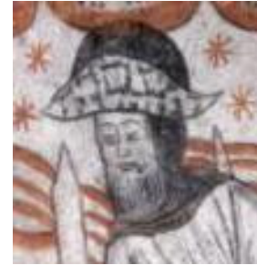
Fig.nr. 11. Josef i Jesu Födelse, Tuse, Roskilde 1460-1480-tal.