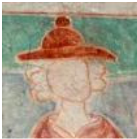
Fig. nr. 9. Josef i Flykten till Egypten, Keldby, Roskilde 1325.