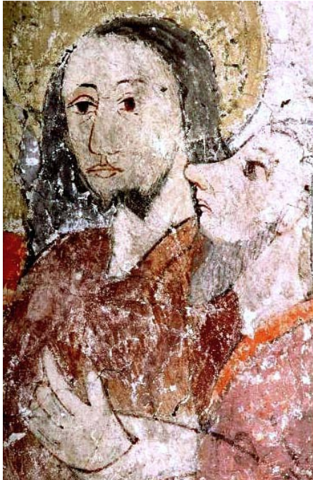
Fig. nr. 2. Getsemane, Judaskyssen. Harg, Uppland 1514.

Att avbilda någon i profil kan visa på ondska, vilket ofta är fallet med Judas, Jesu lärjunge 50 . Judas har i många fall fått representera det judiska, utan att ha fått kroknäsa. I många av bilderna som analyseras avbildas han i profil med grova drag, vilket inte nödvändigtvis behöver visa på judendom. I andra bilder har han en stor näsa som möjligen kan ses som ett judiskt attribut, se fig. nr. 2 och 3.