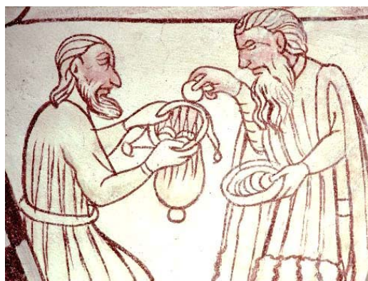
Fig. nr. 19. Judas mottar de trettio silverpenningarna, Brönnestad, Skåne 1425-1450.