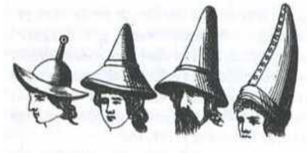
Fig. nr. 12. Olika varianter av judehatter.

Det finns andra typer av hattar avbildade som skulle kunna förväxlas med judehatten, t.ex. rese- eller pilgrimshatten, se fig. nr. 13. Exempelvis Josef har avbildats med olika typer av hatt och det kan vara svårt att bestämma vilka som ska räknas som judehatt eller inte. I denna undersökning räknas toppiga och spetsiga hattar till judehatter i de fall bilderna i övrigt är tänkta att avbilda något som kan representera judendom. Men hattar som är rundade, som den i fig. nr. 11, räknas inte som judehatt.