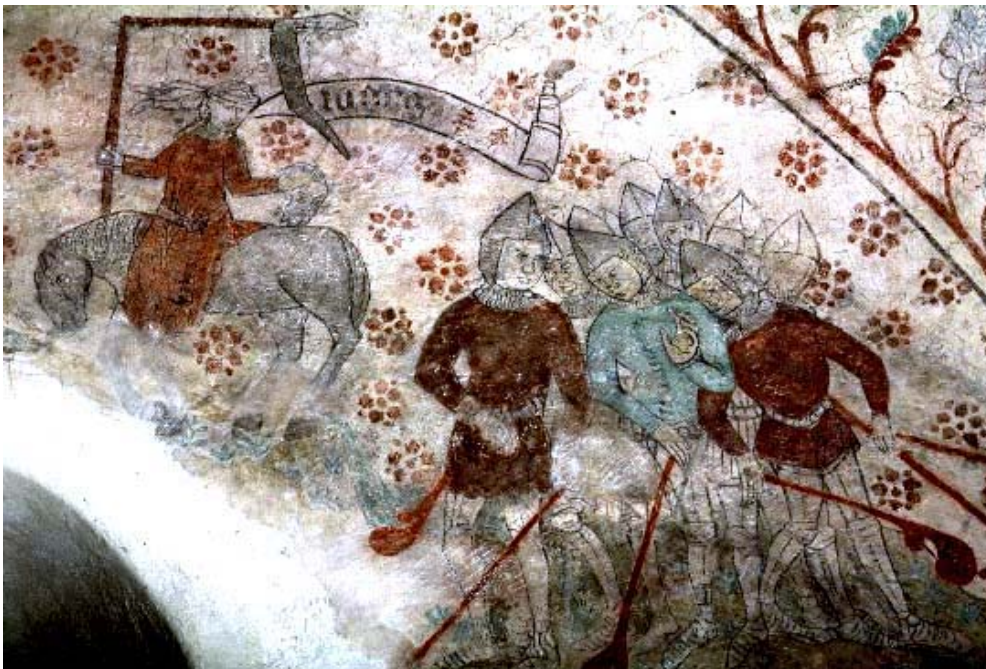
Fig. nr. 15. Synagoga, Spånga, Uppland mitten av 1400-tal.

Att rida bakvänd visar på feltolkningar och konstiga idéer, vilket målaren säkerligen ville applicera på judarna 76 . På bilddatabasen är bilden försedd med titeln ”Synagoga och soldater inför Kristus” och kvinnan ser ut att rida mot Kristus på korset. Bakom henne finns en hop soldater som inte tycks visa intresse i kvinnan eller Kristus. Till vänster om korset finns Ecclesia avbildad med krona, gloria och hel lans, och bakom henne kyrkofäderna.