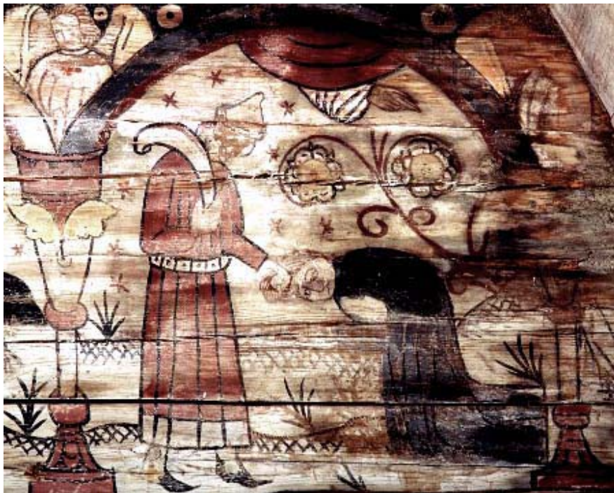
Fig. nr. 20. Brodermordet, Hammarö, Värmland 1475-1500.

Detta syns bl.a. i framställningar från 1475-1500 i Hammarö kyrka på korets västvägg. Här är Abel ljus och mild, Kain har en form av judehatt. Abel har en blå dräkt, som symboliserar Kristus medan Kains är röd för att symbolisera eldens och blodets färg, samt ”obehärskad lidelse och onda lustar såsom hat och grymhet” 106 . Dessa gammaltestamentliga typologier finns ofta i kyrkornas valv och fungerar som förebild åt nytestamentliga scener som finns på väggen längre ned 107 .