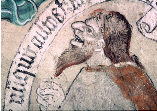
Fig. nr. 4. Kain, Härkeberga, Uppland 1480-tal.

Även Kain framställs ofta i profil, se fig. nr. 4 och 5.