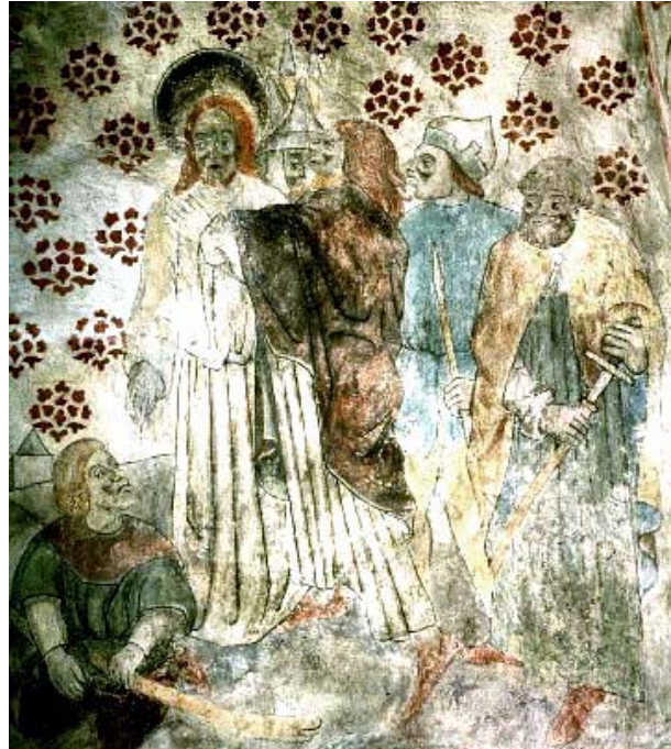
Fig. nr. 3. Judaskyssen. Bromma, Uppland 1475-1500.