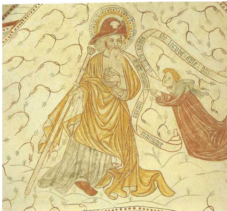
Fig. nr. 13. Aposteln Jacob den äldre, Ballerup, Roskilde 1425-1450.

Det finns andra typer av hattar avbildade som skulle kunna förväxlas med judehatten, t.ex. rese- eller pilgrimshatten, se fig. nr. 13. Exempelvis Josef har avbildats med olika typer av hatt och det kan vara svårt att bestämma vilka som ska räknas som judehatt eller inte. I denna undersökning räknas toppiga och spetsiga hattar till judehatter i de fall bilderna i övrigt är tänkta att avbilda något som kan representera judendom. Men hattar som är rundade, som den i fig. nr. 11, räknas inte som judehatt.