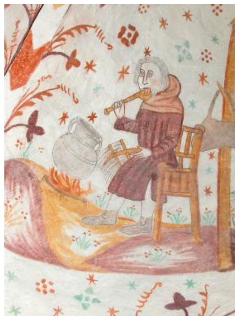
Fig. nr. 17. Josef lagar mat, Jesu födelse, Elmelunde, Roskilde 1475-1500.