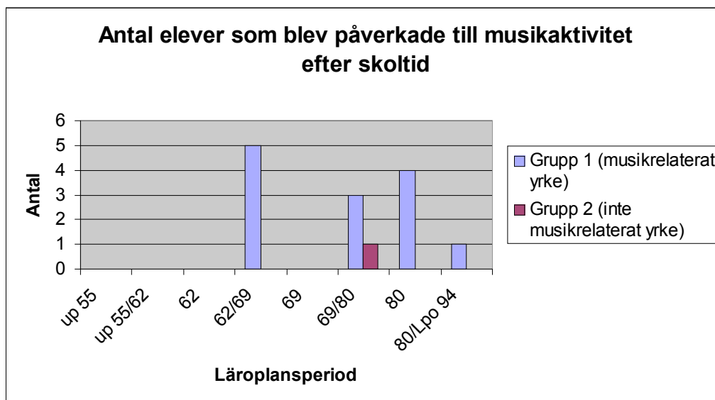
Diagram för antalet instrument musikläraren spelade: Diagrammet visar maxvärdet från avläsning i grupperna 1 och 2, för respektive läroplansperiod. Antalet undersökningspersoner skiftar i de olika läroplansperioderna och grupperna, vilket påverkar resultatet när grupperna jämförs.