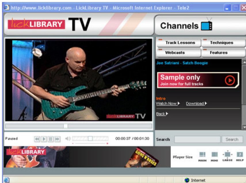
Bild: En gitarrlektion från Licklibrary- TV ( http://www.licklibrary.com ).

På Licklibrary finns ett urval på 20,000 gitarrprodukter som medlemmen kan få upp till 50 procent rabatt på. Det finns 300 jamtracks (bakgrunder att spela till) att ladda hem i olika musikstilar. Det går också att ta del av olika berättelser som musiker delat med sig och de senaste nyheterna inom gitarrvärlden. Det finns även ett chattforum där det går att ladda upp historier, mp3 och videofilmer som medlemmar vill dela med sig. Även för gratismedlemmen finns det ganska stor tillgång till utbudet på sidan. Videolektionerna är dock nerkortade så att hela lektionen inte kan ses utan exempelvis bara ett intro och vers.