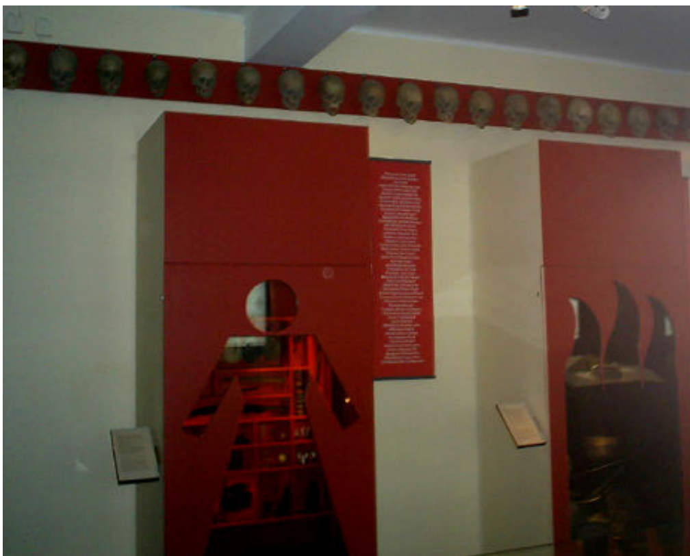
Figur 3. Skallar från ett 40 tal individer uppmonterade under taket på kulturen i lund. Nedanför syns montrar med glasrutor i form av en stiliserad kvinna och en stiliserad eld samt en plansch med mans- och kvinnonamn