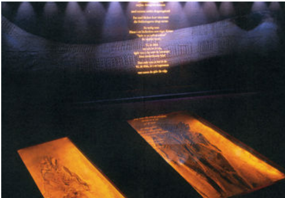
Figur 2. Två av gravarna från Människor som vi . I bakgrunden projiceras en dikt som en del i bildspelet, bakom denna syns en kraftig förstoring av ett objekt tolkat som ett viktigt kultföremål för folket på platsen.

Det är kombinationen av olika förmedlingssätt och informationstexternas behandling av etiska frågor som gör utställningen intressant för min uppsats.