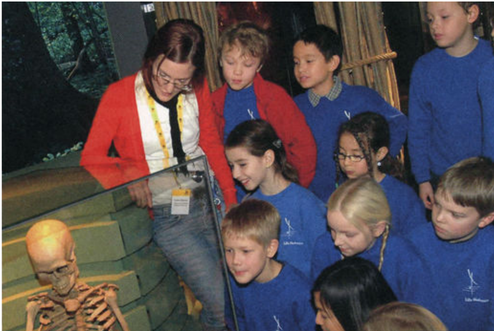
Bäckaskogskvinnan i utställningen Forntider .

Om mänskliga kvarlevor i arkeologiska utställningar