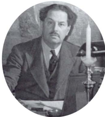
Bild: Erik Palmstierna: Kammardeputerad 1908-17; Statsråd 1917-20.