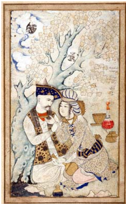
Shah Abbas I med vinpojke

Både vindrickande och pederasti ses som grova synder men Abu Nuwās kritiserar islams moral och gör sin strävan efter njutningarna till en helig strävan, Jihad . Abu Nuwās använde sig av starka homoerotiska symboler och motiv för att skapa moralpanik i det abbasidiska hovet och skaka om de religiösa ledarna under sin tid. Huruvida dikterna speglade hans eget liv och önskningar får vara osagt, viktigast är att de reflekterar attityder och beteenden under en viss period under den islamiska historien.