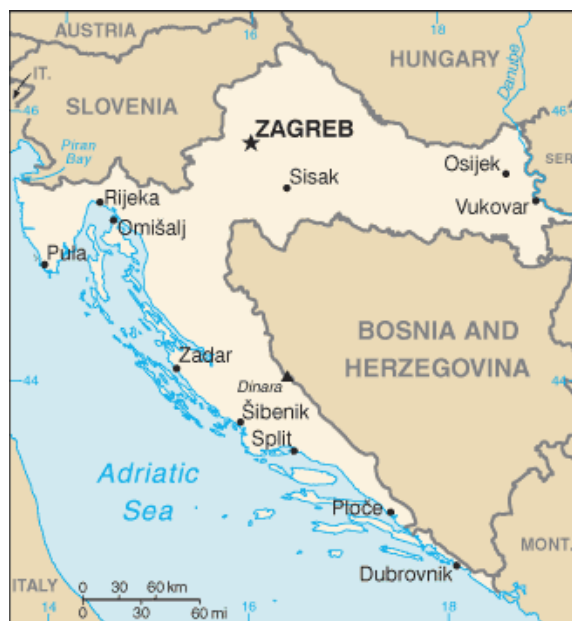
Figur 1: Karta över Kroatien

Dubrovniks historia är händelserik och turbulent. Nedan får Ni ta del av vissa godbitar från grundandet av staden till hur den har kommit att bli turiststaden den är idag. Vi bjuder även på lite geografisk fakta.