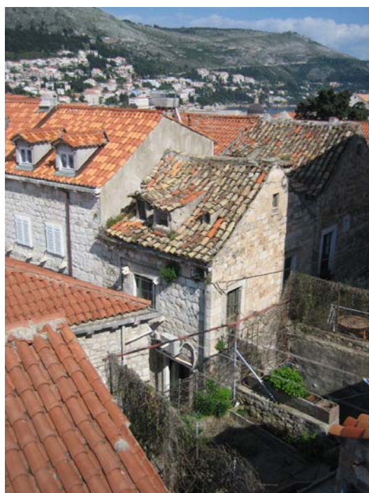
Figur 3: Tak i den gamla staden

Trots ett omfattande och snabbt restaureringsarbete i den gamla staden är det långt ifrån färdigt. Exempelvis fattas det enligt Institute for the Restoration (25/4-2008) fortfarande 250 miljoner dollar för att reparera skadorna som uppstod under jordbävningen 1979. Tourism Board säger att det främst är fasaderna som är restaurerade och sällan insidorna av husen: you can not see anything from the outside, nothing (Intervju, Tourism Board, 24/4-2008). Detta faktum, att det inte finns några fysiska spår efter skadorna på huvudgatan men att respondenterna påstår att restaureringsarbetet av den är långt ifrån färdigt, tyder på att restaureringen skett av estetiska skäl. En aspekt som förhöjer det estetiska intrycket och som vi uppmärksammade under observationen (22-28/4-2008) av den gamla staden är att vid de platser som restaurering pågick var arbetet väl dolt. Arbetsplatserna var övertäckta med träpanel som smälte in i den naturliga byggnadens material (se figur 4). Detta tyder på en vilja att vara diskret vid restaurering för att inte förstöra helhetsintrycket.