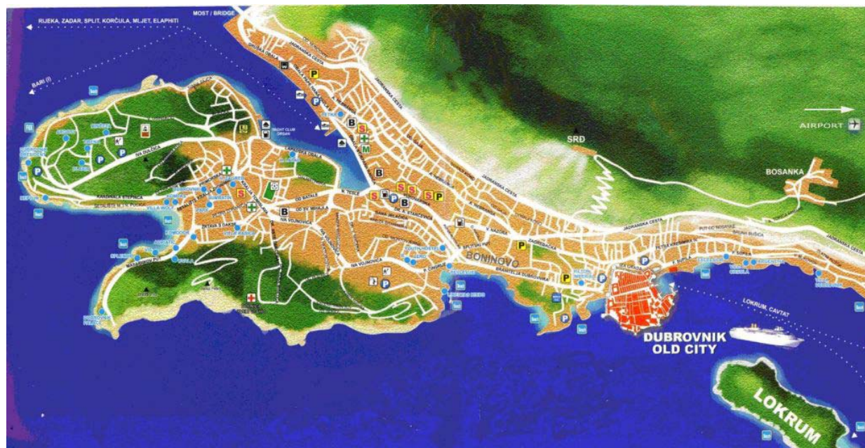
Figur 2: Karta över Dubrovnik

Den gamla staden och dess omkringliggande områden drabbades 1767 av en kraftig jordbävning där många hus och monument förstördes (Dubrovnik stad). Systemet för att ta emot gästerna klarade sig trots tragedin. Under andra halvan av 1800-talet började antalet utländska besökare till Dubrovnik att öka. År 1897 anses vara ett viktigt år för hotellindustrin i Dubrovnik eftersom Grand Hotel Imperial då slog upp sina portar till 70 rum. Detta var det första hotellet i Dubrovnik som höll en högre standard som bland annat innebar elektricitet, central värme samt yrkesmässigt utbildad personal (Visit Dubrovnik).