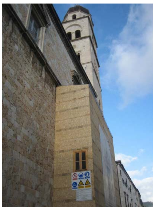
Figur 4: Restaureringsprojekt