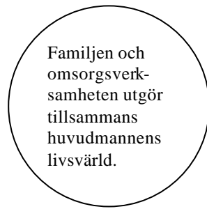
Figur 2. "Gemenskaparen". Varken familjen eller omsorgsverksamheten utgör något centrum. Familjen och omsorgspersonal / omsorgstagare utgör tillsammans huvudmannens livsvärld och familjen och personalen delar på uppgiften att skapa förutsättningar för en god livskvalitet för huvudmannen. God man förefaller ha en kollektivistisk syn på huvudmannen, där huvudmannen har en garanterad plats i samhället och där familjen och samhället samverkar runt insatsen.