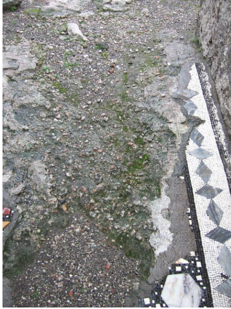
fig. 14 Casa dei Mosaici Geometri