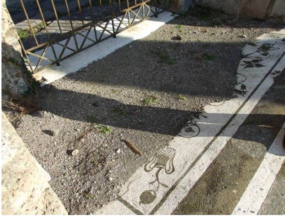
fig. 12 Casa di Aulo Umbricio Scauro