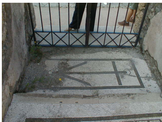
fig. 6 Casa del Fauno