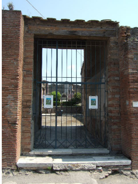
fig. 20 Hus, IX.5.6