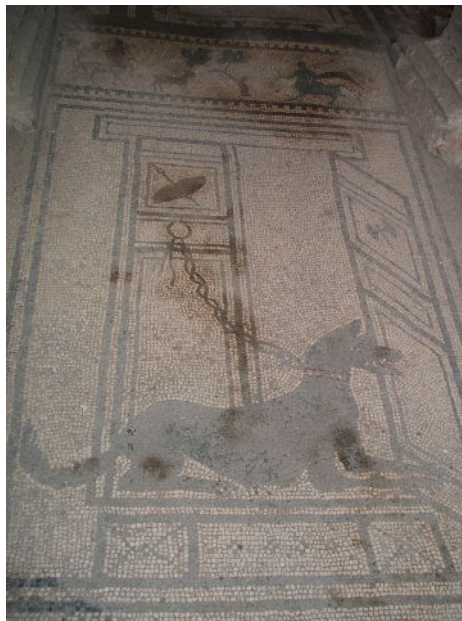
fig. 2 Casa di Cecilio Giocondo