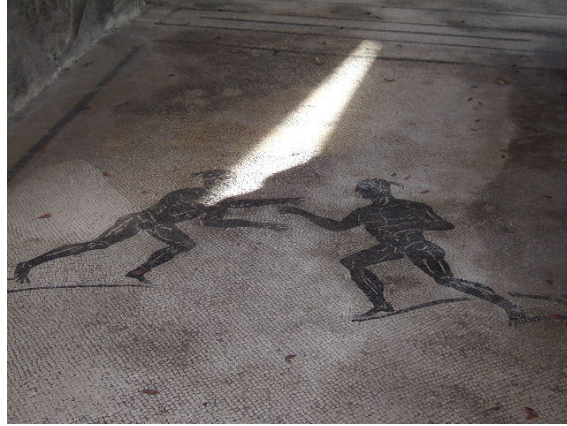
fig. 16 Casa del Cinghiale II