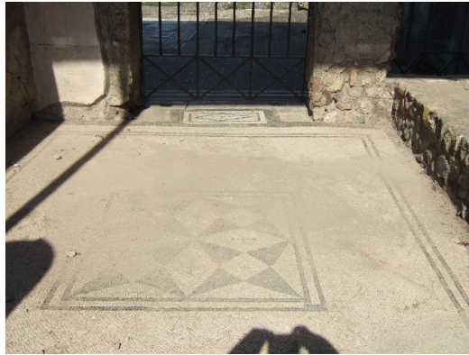
fig. 4 Casa del Poeta Tragico