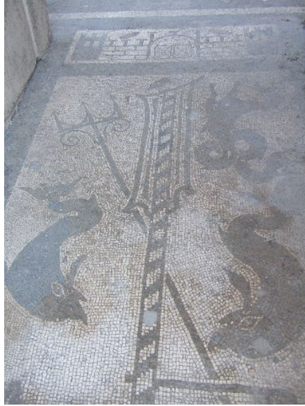
fig. 8 Casa di Vedius Siricus