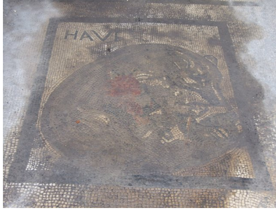
fig. 10 Casa del Marinaio