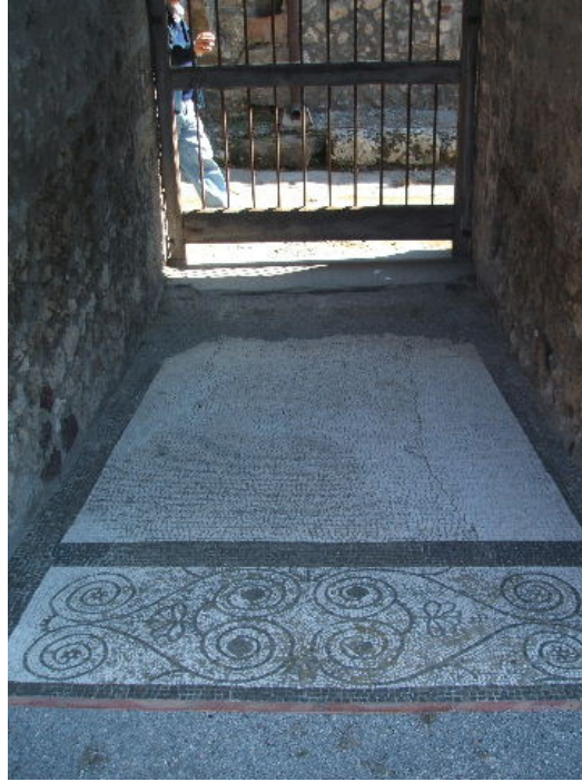
fig. 22 Casa del Centenario