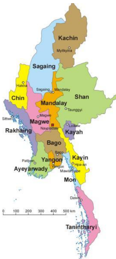
Figur 1: Karta över Burma och landets 14 stater. 1