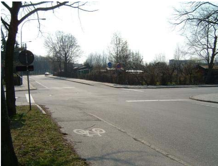
Figur 1.1 Stopplikt i alla fyra tillfarter

Det finns olika åtgärder att tillgå när trafiken ska regleras i en korsning. En av de mest kostnadseffektiva trafiksäkerhetsåtgärderna har visat sig vara att införa flervägsstopp (Linderholm, 1996). Flervägsstopp innebär att det är stopp i alla tillfarterna in till korsningen (Figur 1.1). Avvecklingen av trafikanter sker genom principen FIFO som betyder ”first in first out”. Trafikanten som har stannat först ska alltså köra först. Skyltningen är en vanlig stoppskylt med tilläggstavlan flervägsstopp. Åtgärden används i mycket liten utsträckning i Sverige trots att den medför hög trafiksäkerhet. I hela Nordamerika är det däremot mycket vanligt med flervägsstopp. Flervägsstopp är också en förhållandevis billig åtgärd att införa i en korsning i jämförelse med att t ex anlägga en cirkulationsplats.