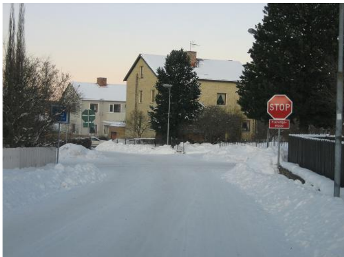
Figur 5.3 Korsningen Rebetskygatan - Skogsgatan

en del inkommande gator. Trafikmängden i korsningarna är generellt mycket mindre i Sundsvall än på de flervägsstopp som har studerats i Malmö. Under studierna i Sundsvall gjordes inga observationer på cyklister eftersom det helt enkelt inte fanns några.