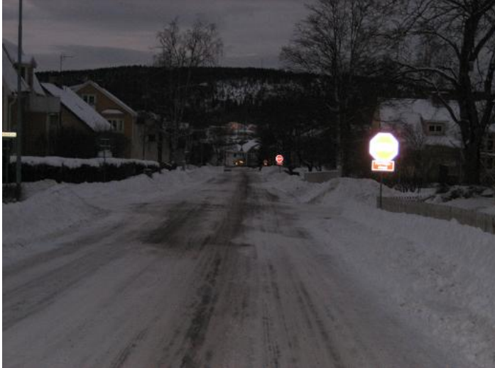
Figur 5.2 Sveavägen - Tre korsningar i rad med flervägsstopp

korsningar på Sveavägen med flervägsstopp. De sattes upp där gatorna Faktorigatan, Kullagergatan och Stockmakargatan korsade Sveavägen (svarta fyrkanterna i Figur 5.1). Eftersom bilisterna nu var tvungna att stanna i dessa korsningar var det inte längre någon genväg att köra genom bostadsområdet Sallyhill. (Figur 5.2)