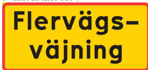
Figur 2.1 Flervägsväjning

En ny vägmärkesförordning kommer att träda i kraft den 1 juni 2007. Det kommer då att finnas möjlighet för vägghållaren att införa flervägsväjning. Skylten kommer att se i princip likadan ut som skylten för flervägsstopp förutom att det kommer att vara en gul väjningspliktstriangel ovanför tilläggstavlan flervägsväjning (fig 2.1) (Vägverket, 2007-1). I en cirkulationsplats är det en typ av flervägsväjning då alla trafikanter i tillfarterna måste väja för de trafikanter som befinner sig inne i cirkulationen. Körbeteendet i den nya typen av flervägsväjning (utan rondell) kommer att vara enligt principen FIFO, d v s ”first in first out”.