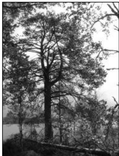
Fig 5. Björnskalleholmen i Grannäs. (Söderlund 2002:21).

I SOFI finns en del namn som påminner om Björnskalleholmen, bl a. Björnskalleudden i Sundsjön, i Värmland, men där finns ingen bakgrund till namnet beskriven. Denna udde tas däremot upp av Edsman och har beskrivits i kapitlet om Jakt och björnoffer . Andra namn i