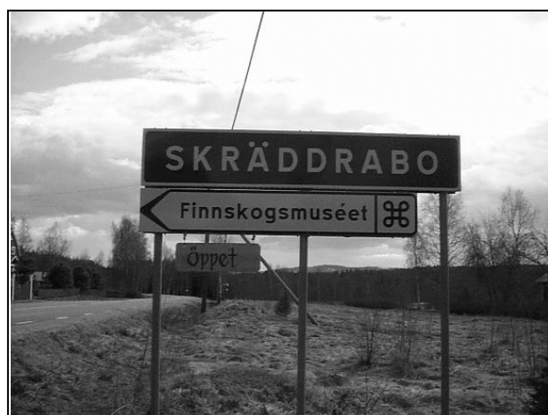
Fig 1. På väg till finnskogsmuseet i Alfta ( http://home.swipnet.se/finnskogsmuseet/ ).

Mycket arbete och forskning görs också i olika nätverk och föreningar som finns för att uppmärksamma det skogsfinska. Den största organisationen i Sverige är ”Finnbygder i samverkan”, FINNSAM. Föreningens syfte är både att informera och sprida kunskap och att vara ett nätverk som främjar samverkan mellan enskilda personer och föreningar och institutioner ( http://www.finnsam.org/ ). Det finns alltså en mycket stor mängd intresserade och kunniga