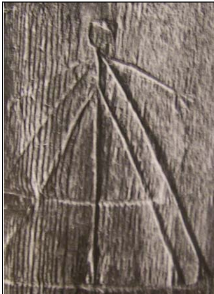
Fig 2. Inristad kvinnofigur, uthusdörren på Rikenberg, Bjurberget i Värmland. (Stenman 2001:174).

En del i den svarta magin bestod i att skicka trollskott på människor och husdjur så att de fick olika sjukdomar, sår eller dog. Ett sätt att gå tillväga var att använda sig av bilder. Det innebar att man högg ut en människobild i en furustam eller täljde ut en sådan ur ett trästycke (fig. 2). Dessa bilder kallas "mieskuvia" (Gothe 1943:75f; Stenman 2001c:166).