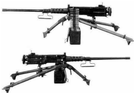
45 Bild 1:2

Light weapons definieras som vapen designade för att användas av en grupp på 2-3 personer. Dessa kan bland annat vara tunga kulsprutor, granatgevär och granatkastare med kaliber under 100 mm. 44 Ett exempel på dessa är den amerikanska tunga kulsprutan Browning 12,7 mm.