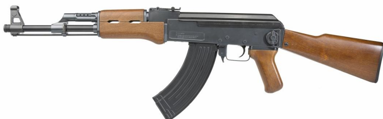
43 Bild 1:1

Förutom statlig inblandning i den grå handeln så finns det även skillnader mot den svarta i fråga om volymer. Volymen på handeln skiljer sig på grund av vapentillgång hos den säljande staten och transportkapacitet. Då stater är inblandade så behöver inte vapnen gömmas bland annat gods, utan kan istället skickas i ett helt fartyg till mottagaren. Dessa större transportmöjligheter möjliggör att man kan skicka tyngre vapen så som stridsvagnar och artilleri. Medans det på den svarta marknaden nästan uteslutande är mindre handburna vapen. Handburna vapen definieras av FN som ” Small arms and light weapons ” . Small arms definieras som vapen designade för användning av en individ. Detta inkluderar pistoler och gevär men också automatkarbiner och lätta maskingevär. 40 På bilden nedan visas en klassiker vad gäller illegala small arms . Den sovjetiska AK47 (Avtomat Kalashnikova -1947), vanligt kallad Kalashnikov kan kosta så lite som 20 dollar på den illegala marknaden, 41 mellan 70 och 100 miljoner ex finns i omlopp. 42