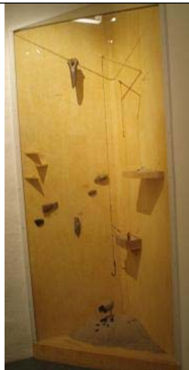
Figur 6 – Monter med boplatsmaterial, som t.ex. fiskekrokar, tvärpilar och kärnyxor.