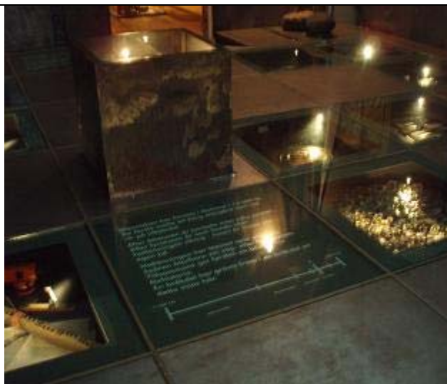
Figur 3 – Golvmontrar, upphöjd monter och textruta. Sammanfattande bild av hur utställningen var uppbyggd, sedd från ingången till utställningen.