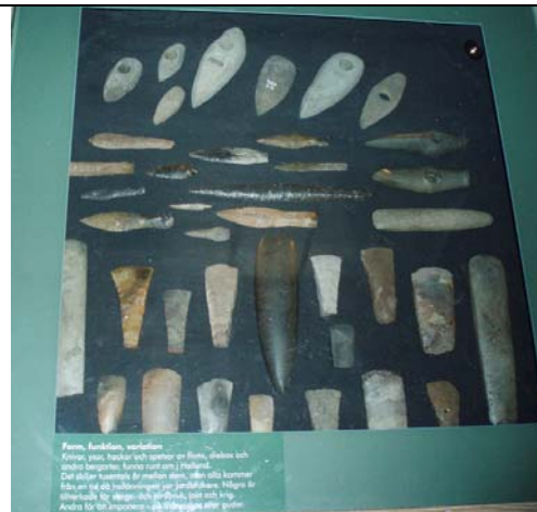
Figur 8 – Monter med en mängd olika yxor, knivar och hackor av flinta och olika bergartsmaterial till varierande användningsområden.

Fotografi taget av mig vid mitt besök 2010-03-21