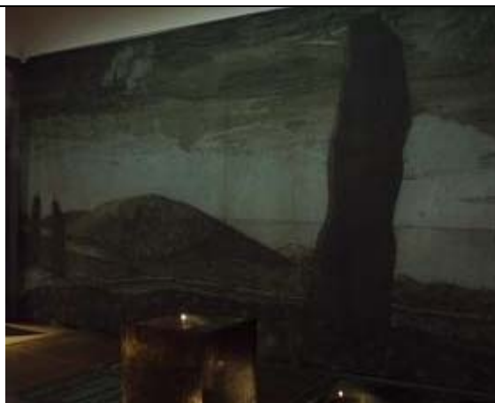
Figur 4 – Landskapsmotiv på en väggtextilie i utställningsrummet.