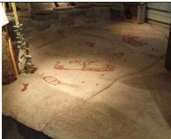
Figur 2 – En rekonstruktion av en hållristningshäll i naturlig storlek.