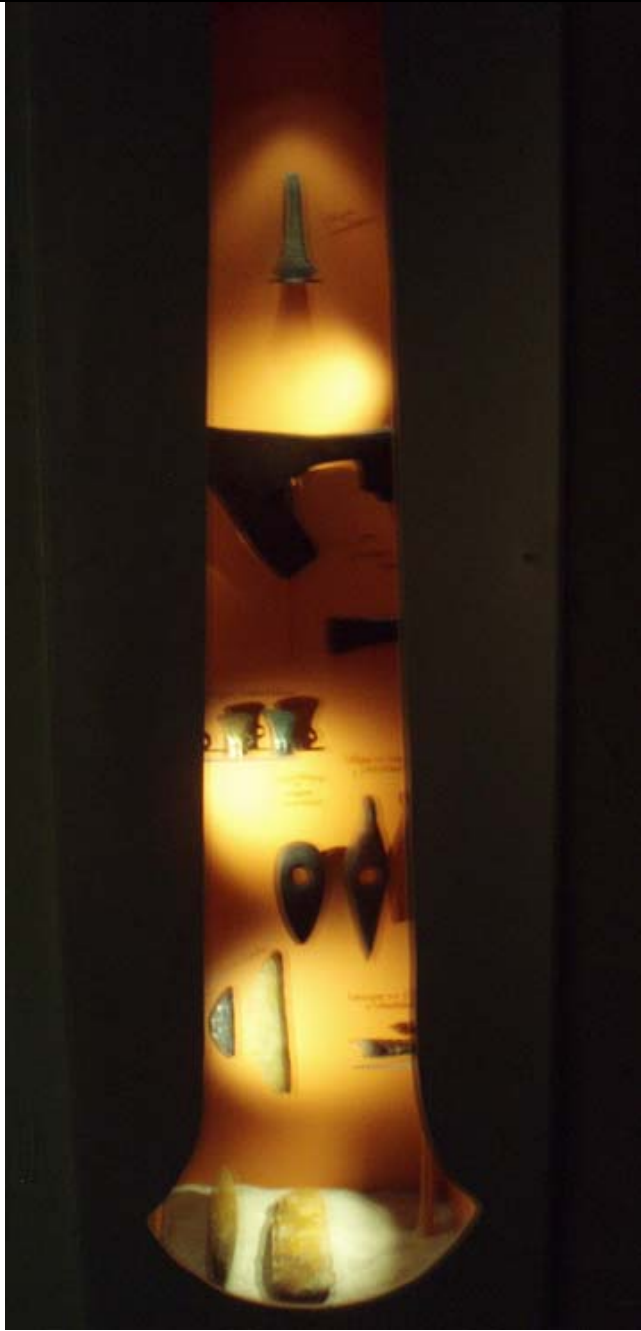
Figur 9 – Monter med yxor av olika typer, utan indelningar om vad de använts till.