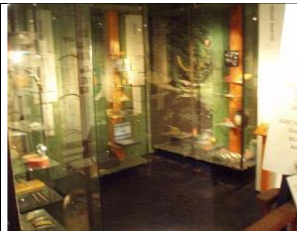
Figur 1 – De fyra temamontrarna på Blekinge museum, sett från ingången till utställningen.