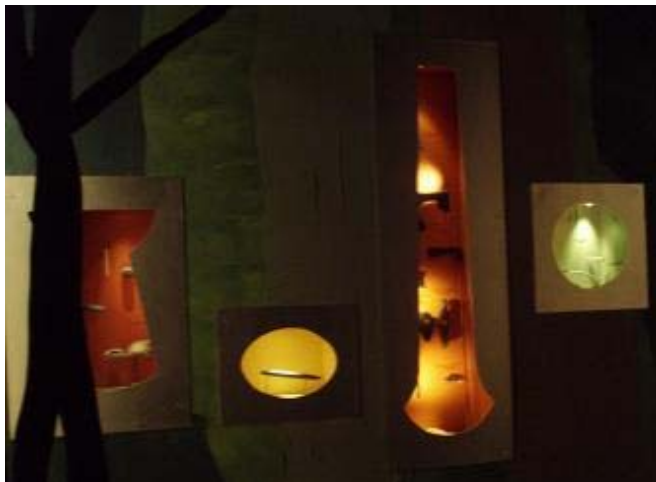
Figur 5 – Montrar inbyggda i väggen i ett svagt belyst rum. Montrarna innehöll bl.a. keramik och yxor.