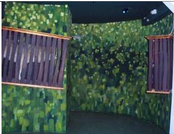
Figur 7 – Kamouflagefärgade väggar och två upphängda burar innehållandes en varg och en liten ”tomte”. Slutet på den förhistoriska delen av utställningen.