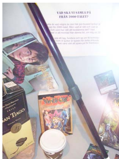
Öppet pga inventering (fig 9 & fig 10) på Landskrona museum.