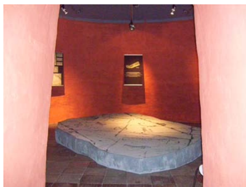
Österlens museum Café-au-film (fig 1) och Hällristningarna i tornet (fig 2).

Österlens museum är representerat på hemsidan www.kulturhistorien.se där även andra lokala sevärdheter finns representerade. Denna hemsida tillsammans med broschyrer kan underlätta för besökaren att hitta till guldkornen i det kulturella landskapet. Trelleborgs museum har också ett café med en separat biograf som visar filmer från Trelleborgs stad. Museet saknar dock en anknytning till det omgivande landskapet och koncentrerar sig mer på staden. Landskrona museum har också ett café med en tv som visar en film om en av utställningarna, dock saknar även detta museum en anknytning till det omgivande landskapet. Ystad klostermuseum har ett café men ingen motsvarande filmhörna. Detta museum har heller ingen permanent utställning om staden.