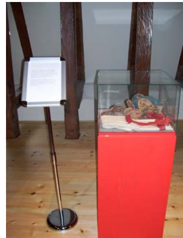
Rosor och Svartkonst på Trelleborgs museum (fig 7) Textilutställning Österlens museum (fig 8).