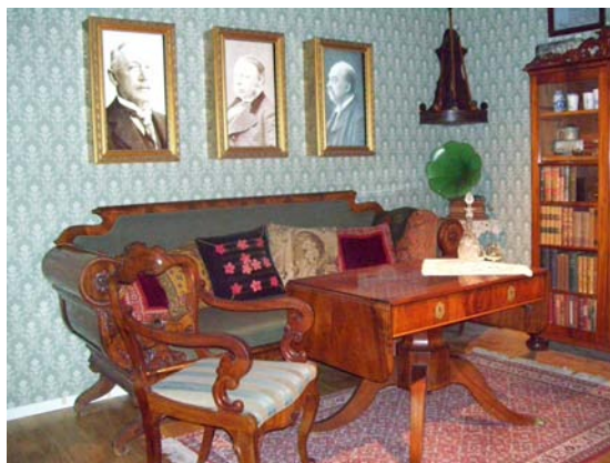
Trelleborgs museums stadshistoriska utställning (fig 16).

handskas med dessa medier. Detta gör att definitionen av museer försvagas och koncentrationen hamnar helt på berättelsen. Innehållsmässigt kan dessa medier då ha en effekt på föremålen och dess kunskap, men budskapet förblir troligtvis detsamma.