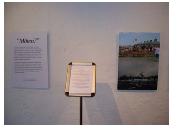
Österlens museum utställningen "Möten" (fig 3 & 4).

Denna utställning visar fotografier med beskrivande text, men utställningen kan ge känslan av något stelt och avskalat. Man kan få känslan att man behöver visningar för att få mer information och på så vis levandegöra utställningen. Vid vissa datum anordnar museet stadsvandringar och det hade varit ypperligt att sammanföra utställningen med just dessa för att föra ut museet i stadsrummet.