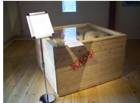
Rädsla utställningen på Österlens museum (fig 11 & 12).