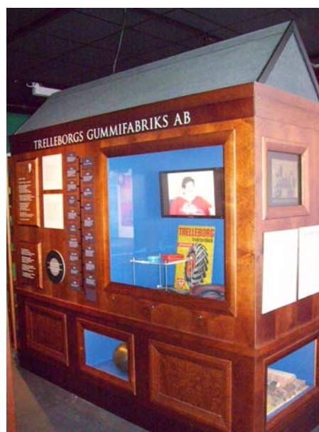
Den stadshistoriska utställningen på Trelleborgs museum (fig 17 & 18).

Oftast behöver man då hjälp av guidade visningar för att få ett bredare intryck av utställningen och mera information. På invigningen av Österlens museum fanns det berättare vid de olika utställningarna som levandegjorde de annars rätt stela och avskalade föremålsmontrarna. Annars ses dock föremålsmontrar som något stillsamt som man kan betrakta i sin egen takt. De museer som har använt sig av rekonstruktionsmetoder i utställningarna har troligtvis gjort det för att göra samlingarna mer levande och på så vis locka fler besökare. 116 Idag är upplevelsen satt i fokus ifrån allt inom marknadsföring till lärande. Mycket kretsar kring upplevelser och i den utvecklade världen tenderar det till att bli det främsta mervärdet inom design, kulturturism och lärande. 117 Ur ett nöjesperspektiv kan rekonstruktioner vara fördelaktigt för turismen, men det strider oftast mot vad en del forskare anser med nytta. Det vill säga att forskaren snarare vill bilda och erbjuda ny kunskap. Detta står i kontrast gentemot relationen till rekonstruktioner som debatteras utifrån moraliska synpunkter angående nytta och nöje. Men man måste ha i åtanke att synpunkterna färgas av betraktarens utgångspunkt. 118