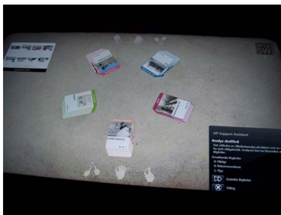
Stadshistoriska utställningen på Trelleborgs museum (fig 19).

Det finns en värld av olika bildnings- och kunskapsnormer och alternativa pedagogiska modeller och museerna står ständigt inför nya uppgifter i offentlighetsarbetet som de demokratiska kulturinstanser de är. Det krävs att ett museum har utåtriktade utställningskoncept skapade med experimentlust och vetenskaplig nyfikenhet med uttryckta tydliga förmedlingsmål för att möta publikens anspråksfulla krav. 121 Trots dessa krav kan man säga att museerna lätt fastnar i gamla metoder och ser tekniken som sin räddande ängel för att framföra sina budskap. Man fastnar i berättelsen och frångår de traditionella föremålen som anses vara döda ting och inget användbart verktyg i denna moderna era. Dock kan man som museum inte frånga föremålen helt och de kläms in i montrar som vanligt och fastnar där som monument över det förflutna. Landskrona museum försökte att genom sin utställning ”öppet pga inventering” möta publiken genom att erbjuda allmänheten att ställa ut sina föremål. Trots det så fastnar även de i montrar på rad med förklarande text och betraktas som ännu ett led i stelhet och ouppnåbar kunskapsförmedling. Men museiutställningen som sådan är och kommer nog alltid att vara ett stillsamt medium. Så istället för att försöka skapa upplevelser och aktiviteter så kanske man ska bejaka detta och utgå ifrån detta faktum när man vill förmedla kunskap. Men det är inte fel att försöka levandegöra utställningarna ändå.