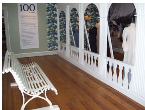
Utställningen "För hundra år sedan" på Landskrona museum (fig 15).