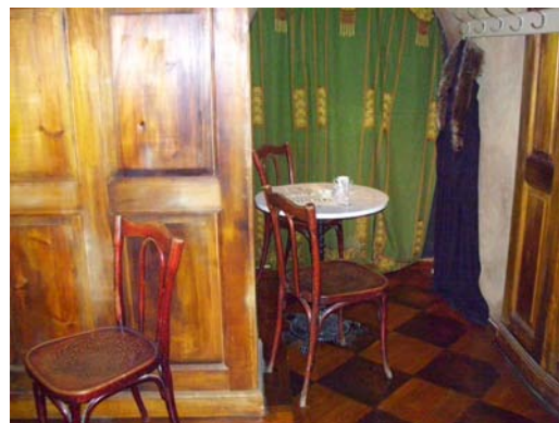
Nell Waldens café på Lanskröna museum (fig 13 & 14).

Ystads museum använde sig av dockor och målade vapensköldar som inte var originalföremål och därmed gick de ifrån föremålsfokuseringen totalt. Man kan hävda att man både kan förstärka föremålsintrycket med in-situ eller välja bort det helt och hållet. Idag kan man säga att Österlens installationer följer in-kontext -metoden, men där förklaringar, historiska fakta, frågeställningar och jämförelser kan verka korthuggna, vilket gör att budskapet kan ses som svårtolkat. I Österlens museums förra utställning "Plogfynd" hade man en in-situ -utställning av en samlares hem. I Trelleborgs museums stadshistoriska utställning använder man sig av