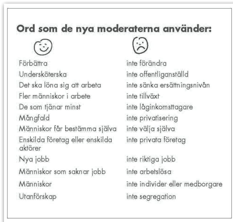
Figur 2 Nya Moderaternas "ordlista"

Sist på listan hittar man "utanförskap", begreppet som ursprungligen skulle fungera som en ersättning för "segregation" men som relativt snabbt kom att bli det centrala begreppet inte bara för Moderaternas utan hela Alliansen. Begreppsramning som en medveten politisk praktik har om inte tidigare så med de "nya moderaterna" definitivt gjort sitt inträde på den svenska politiska arenan.