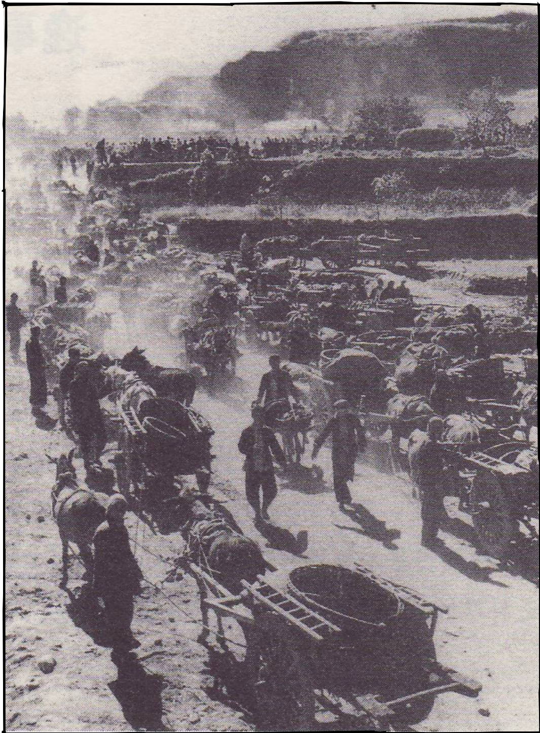
Bild 7 - Bönderna bryter kol och smälter stål istället för att ta hand om skörden, Anyangs län, Henan