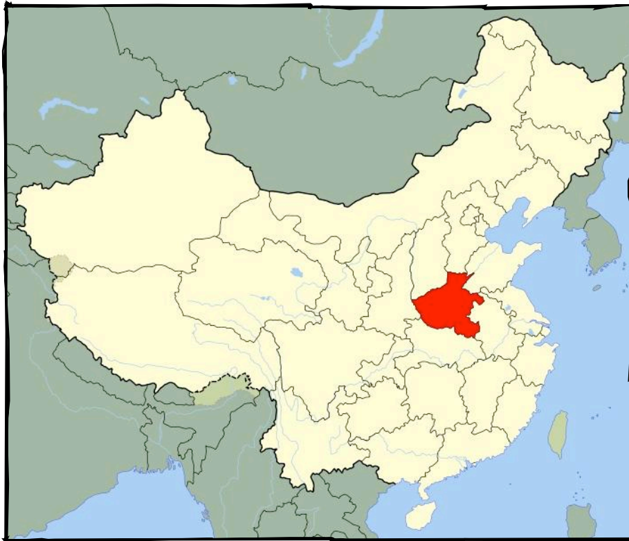
Bild 1 - Kina och provinsen Henan