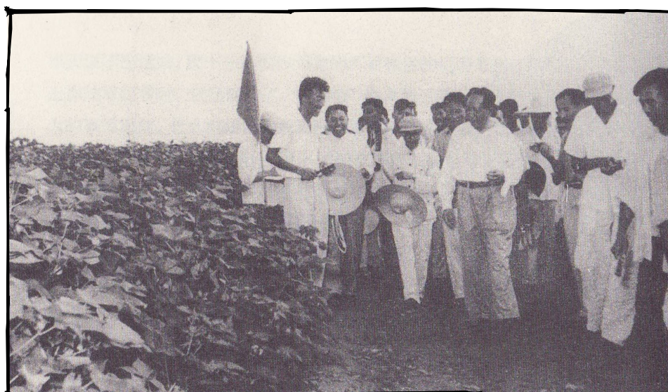
Bild 4 - Mao Zedong inspekterar skörden i Qiliyings folkkommun, Augusti 1958, Henan

Med Mao, Marx och Stalin som ledstjärnor så skulle folket föra utvecklingen i stora språng istället för sakta men säkert som annars var normen. För att engagera och inte minst kontrollera Kinas 500 miljoner bönder skapades en ny minsta organisatorisk enhet på landsbygden. Istället för den tidigare enheten xiang (乡) (som på engelska brukar översättas med township ), infördes en vidareutveckling av jordbrukskollektiven (农业生产合作社): folkkommunen. Dess ansvar utökades och folkkommunen ansvarade för all utbildning, industri, handel, militär och jordbruk i dess närområde. Dessutom överläts all privat egendom, land och utrustning till kommunens ägo för att omfördelas efter behov och utnyttjas maximalt. Kommunerna var betydligt större än jordbrukskollektiven med en storlek på 2 000 hushåll eller ungefär 10 000 människor, vilket typiskt betydde en kommun per xiang.