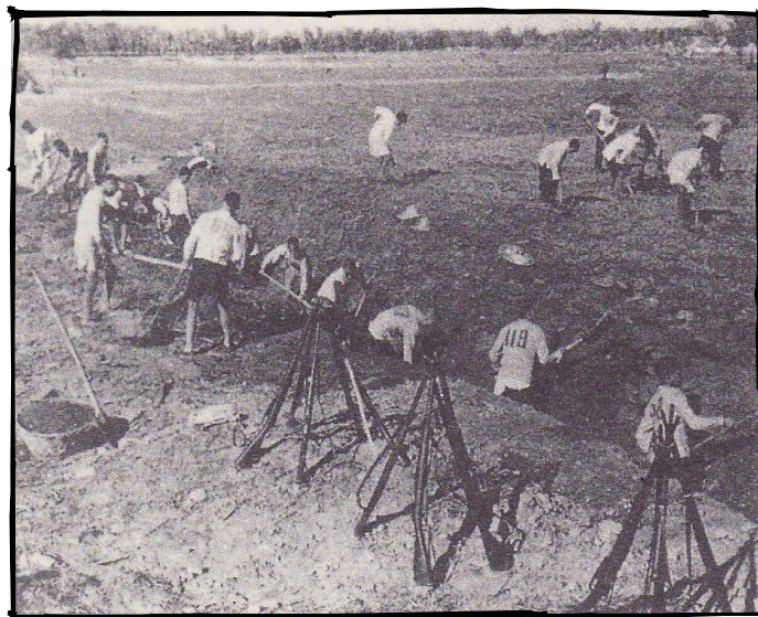
Bild 5 - Många bönder tjänstgjorde även i hemvärdnet, Dongjiaos folkkommun, Zhengzhou, Henan

För att hålla moralen och Språngets tempo uppe så jobbade regeringens propagandaavdelning på högvarv. Livet i kommunerna genomsyrades totalt av Språngets anda, rekordskörd efter rekordskörd rapporterades, dikter och sånger skrevs om lyckan i att arbeta tillsammans och kollektiviseringen som vägen till det socialistiska paradiset propagerades.