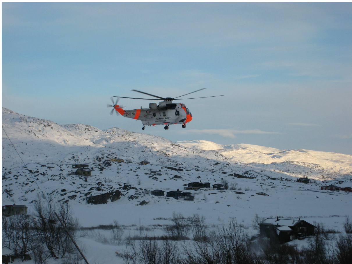
Bild 2. Norsk räddningshelikopter under övningsolycka vid Bjørnfjell, Norge.

Alla respondenter är överens om att personliga relationer har stor betydelse i samverkan. Att känna varandra gör det betydligt lättare att kunna ta kontakt och få saker genomförda. Dock vill flera påpeka att det fortfarande är funktionen som i det långa loppet måste fungera för att samverkan skall kunna hållas kontinuerlig.