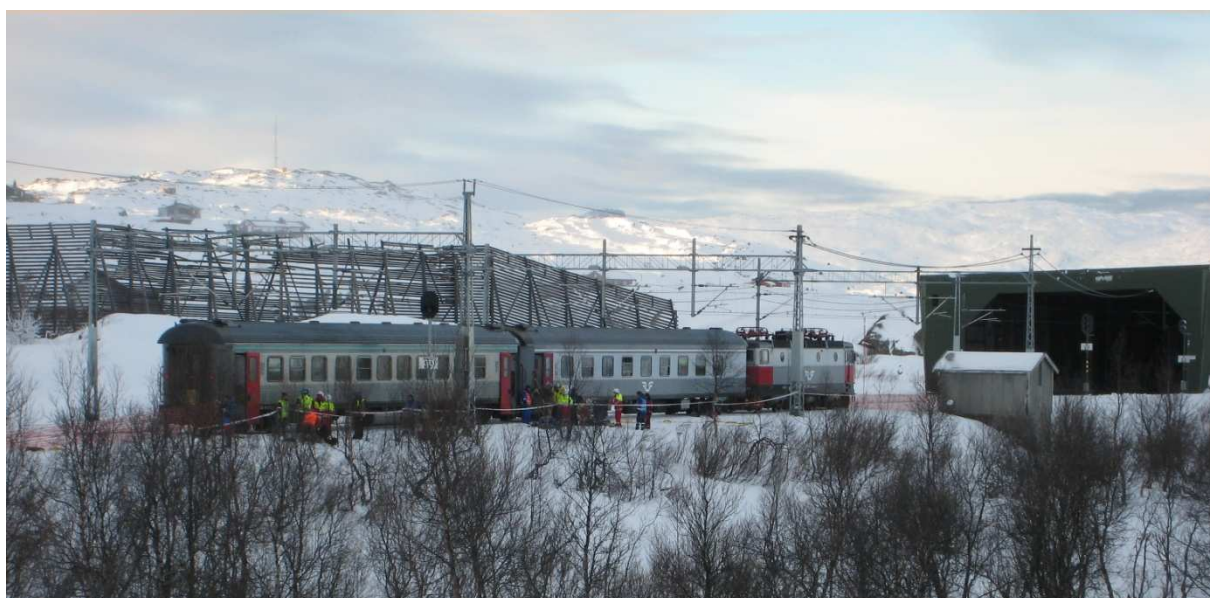
Bild 1. Övningsolycka vid Björnfjell, Norge.

Förutom övningsverksamheten har man gjort ett antal utbyten och träffar mellan inblandade aktörer. Tanken är att man skall göra gemensamma brandtillsyner på främst fjällanläggningarna men på sikt även på objekt längre in i länderna.