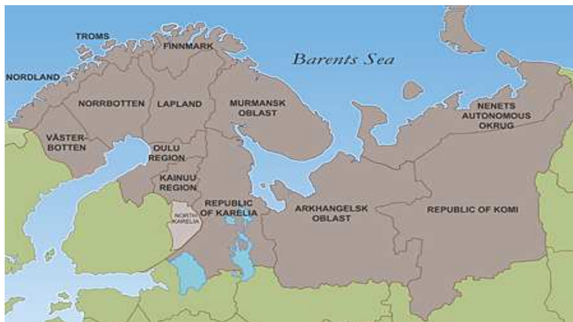
Figur 1. Område för Barentssamarbetet

Förutom Nordred så finns för norra delen av Norge, Sverige och Finland samt nordvästra Ryssland Barentssamarbetet vilket bildades 1993 ( se figur 1). Barentssamarbetet är ett gränsöverskridande arbete som syftar till att utveckla regionen både socialt och ekonomiskt. Inom denna samverkansform finns ett ramavtal vilket skall förenkla arbetet för insatser vid nödsituationer samt förebyggande arbete.