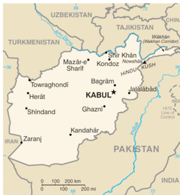
Figur 1. Afghanistan Källa: CIA 1, 2011

Afghanistan har en landyta på 647 500 km 2 (ca 1,5 Sverige), har ca 30 miljoner invånare med en medelinkomst på 1000 dollar per capita. Afghanistan är ett stamsamhälle bestående av 4 större och ett 30-tal mindre folkgrupper. Det största är Pashtuner som utgör 42 % av befolkningen (ordet afghan är en poetisk omskrivning av pashtu). Islam är den dominerande religionen med 80 % sunnimuslimer, 19 % shiamuslimer och 1 % med annan trostillhörighet. Statskicket är sedan 2001 en republik med folkvald president, indelat i 34 regioner med centralt utnämnda guvernörer. Kabul är huvudstad med ca 3.5 miljoner invånare (CIA 1, 2011).