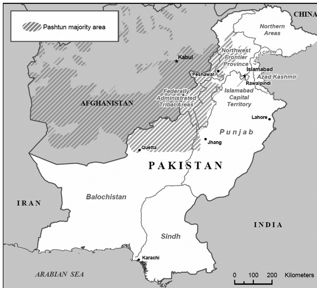
Figur 5 Gränsen mellan Afghanistan och Pakistan

Den praktiska gränsdragningen var en svår uppgift för de ålagda vilka försökte följa naturliga landmärken längs den 2640 km långa gränsen. I de norra delarna innebar Hindu Kush bergskedjan en naturlig gräns, vidare söderut Mohmandbergen med ett utmärkt undantag, vissa bäckar och floder delades upp, men vid avancemanget söderut tunnades naturliga hållpunkter ut. Gränsen är geografiskt svår att urskilja och på sina ställen omöjlig att identifiera i sin omgivning. Figur 5 visar de provinser som påverkades av gränsdragningen och den utbredning som pashtunerna har på båda sidor gränsen. Gränsen har två legala gränsövergångar för den stora dagliga trafiken, Torkham i norr och Chaman i söder, och ytterligare ett tjugotal frekventerade gränsövergångar är bemannade. Det finns utöver detta 111 gränsövergångar i norr och 229 i söder som är illegala och kända. (Johnson, 2008, s.44).