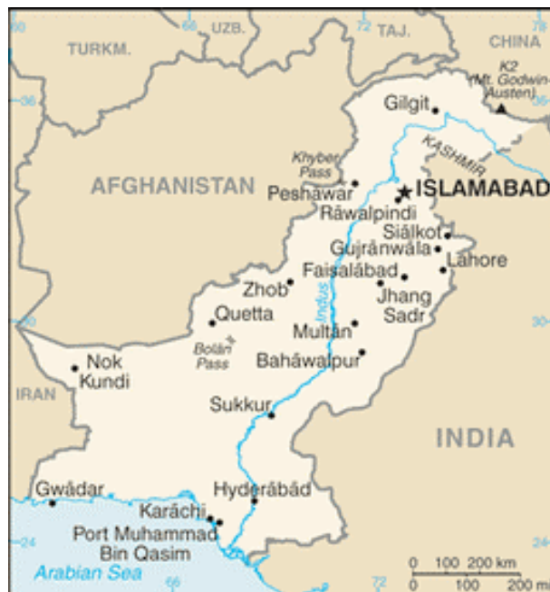
Figur 2. Pakistan.

Pakistan har en landyta på 803 940 km 2 (ca 1,8 Sverige), har ca 174,5 miljoner invånare med en medelinkomst på 3000 dollar per capita. Statskicket är semipresidentialism och indelat i 4 provinser, 2 territorier och 2 speciella områden. Landet är muslimskt med ca 75 % sunnimuslimer, 20 % shiamuslimer och resten av annan trostillhörighet. Punjaber är den största folkgruppen. Pakistan har cirka en miljon afghanska flyktingar i landet (CIA 2, 2011).