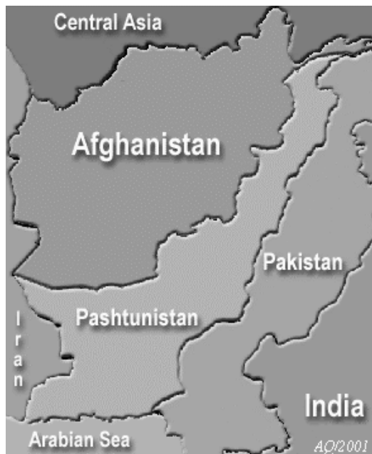
Figur 3. Pashtunistan

Under många år drevs linjen från Afghanistan att det skulle bildas ett självständigt Pashtunistan. Figur 3 visar ett tänkt Pashtunistan där Durandlinjen utgör dess västra gräns. Pashtuner, pakshtuner, pathaner eller pashtooner lever ett delvis bofast och delvis nomadliv på båda sidor av gränsen och deras tillhörighet är fortfarande en oupplöst dispyt mellan Pakistan och Afghanistan. Efter Pakistans självständighet vid 1947 uppstod stora motsättningar främst i NWFP, North-West Frontier Province , vid den förestående sammanslagningen med den punjabi dominerade nordvästra befolkningen i dagens Pakistan.