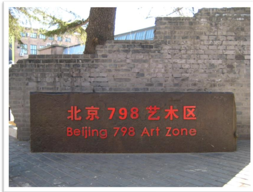
Figur 4.1 En av många entréer in till området