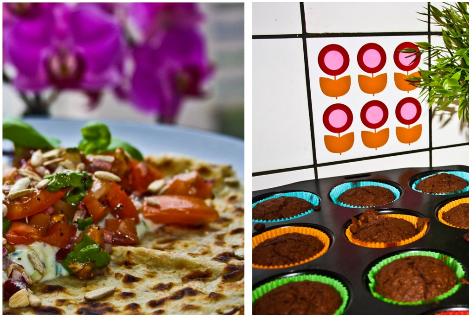
Exempel på matfotografier.

utrusning vilket Fredrik poängterar. Då landar man istället i en kostnadsfråga då bra kameror oftast är ett dyrt kapitel och frågan är hur mycket pengar man är villig att lägga ner på ett verktyg till sin blogg? Oavsett om man väljer att investera i en bra kamera eller ej, så är just matbilderna något som alla mina informanter lägger ner väldigt mycket energi på och som Emma säger, så ”tror jag att matintresserade går in och tittar mycket på bilder och läser mindre, men inom andra genrer så kan man nog klara sig bra utan bilder.”