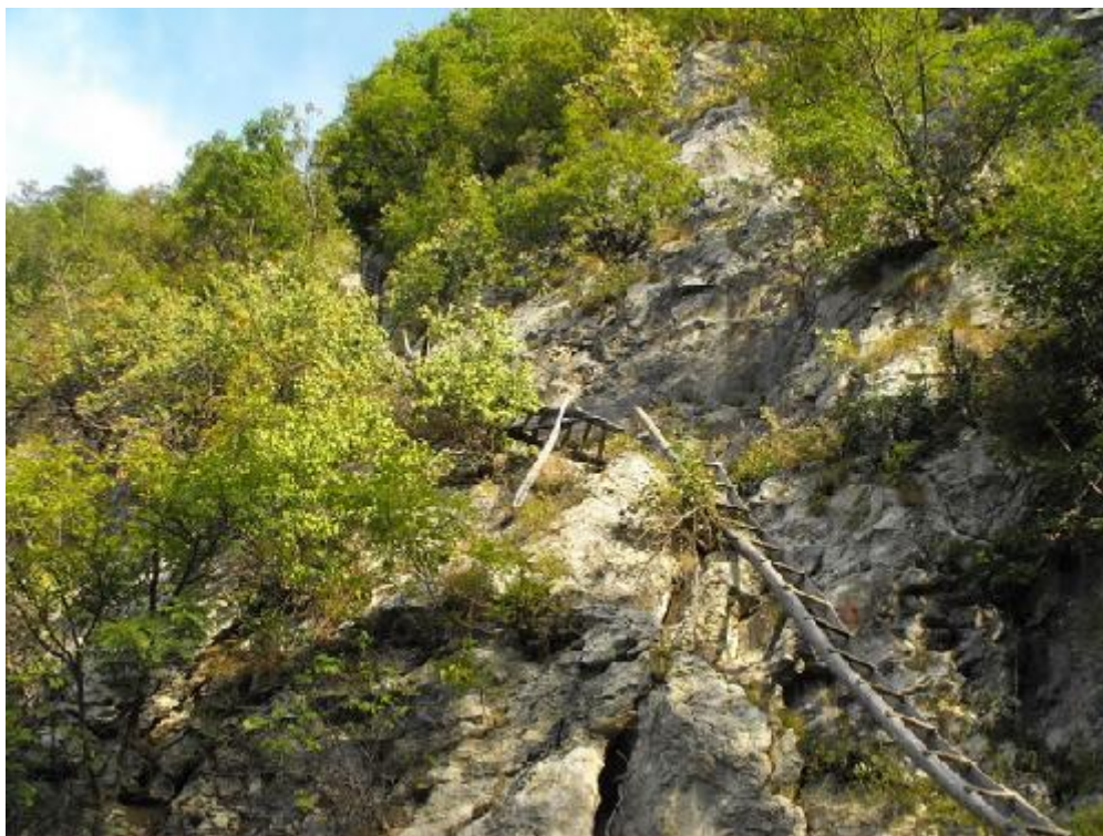
Drumul de acces spre Scărișoara www.carpati-valea-cernei.com

Locuitorii acestor cătune își poartă îmbrăcăminte confecționată de ei din lâna oilor pe care le cresc, toarsă manual după cum au învățat de la moșii și strămoșii lor. Străbat munții încălțați în opinci tot de ei confecționate și locuiesc în case simple, deseori cu o singură cameră, unde se izolează de gerul iernii sub zăpezile care le acoperă singurătatea.