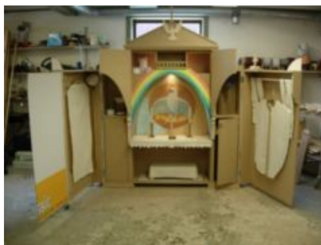
Barnens altarskåp, Leksacer, från Västerås domkyrka.