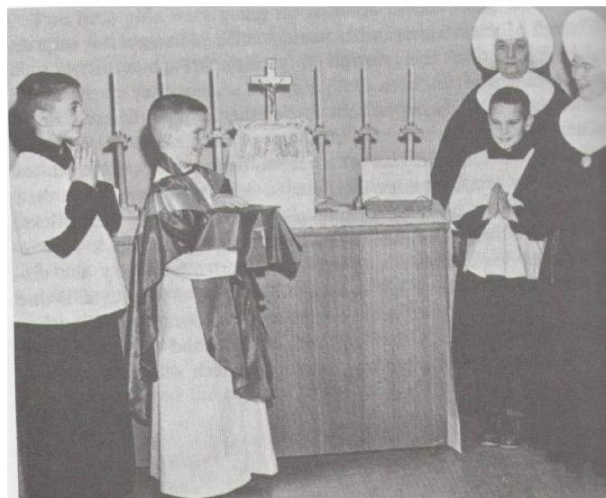
Barn som leker mässa i Seattle. Bild ur The Child in the Church , (Standing 1965) s. 176