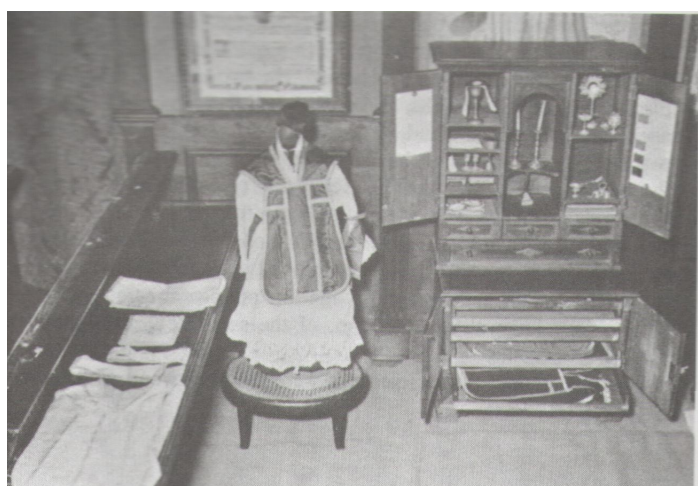
En "Atrium Cupboard" från Rom, slående lik ett barnens altarskåp.