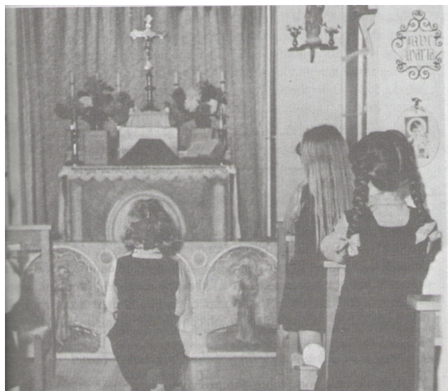
Barn som ber i St. Anthony's school i London.

För att du som läsare ska få en tydligare bild av vad en lekkyrka och ett barnens altarskåp är bifogar jag här några foton.