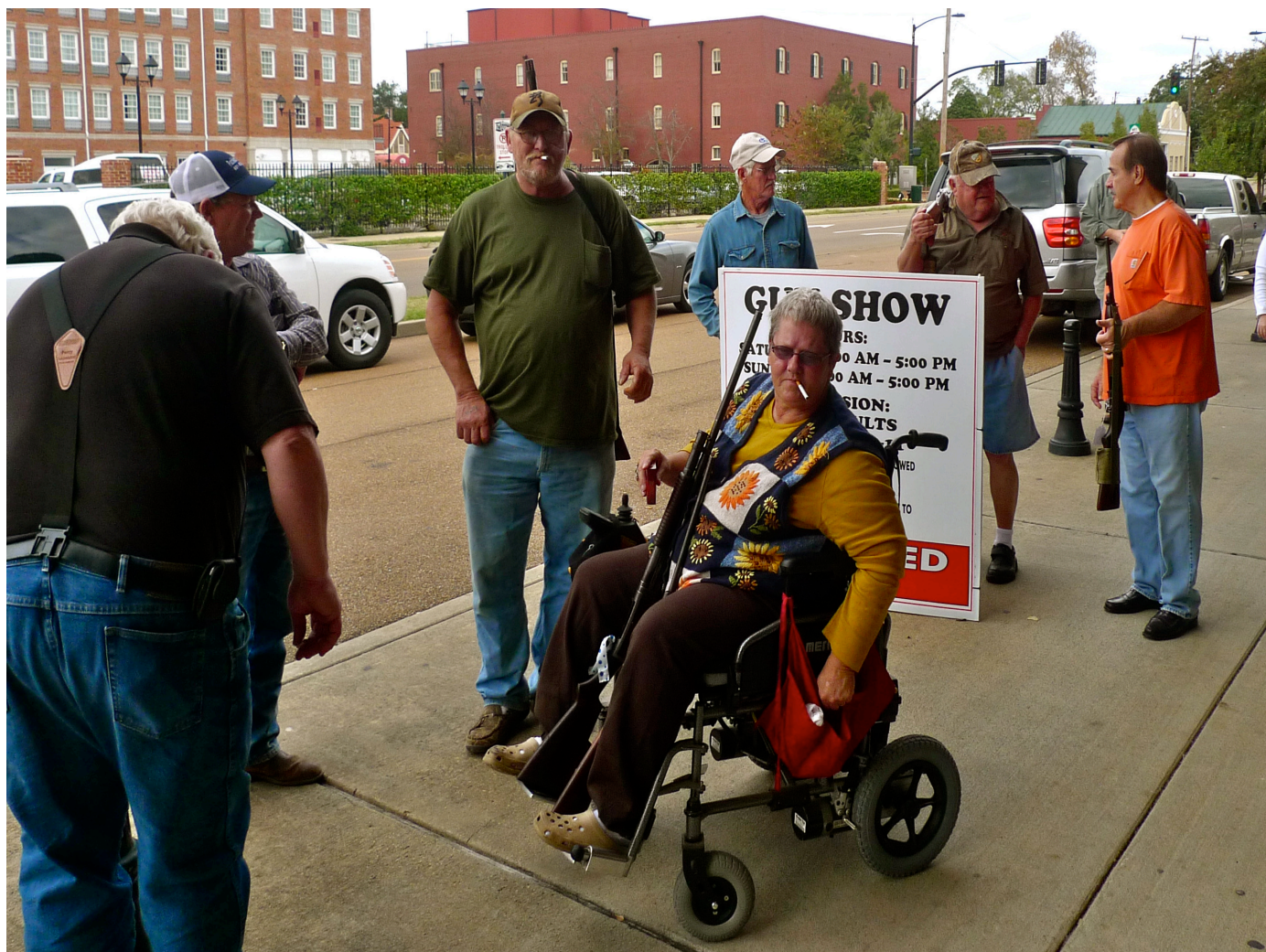
I Mississippi är det vanligt att äga flera vapen. De används för nöjesskjutning, till jakt och försvar.