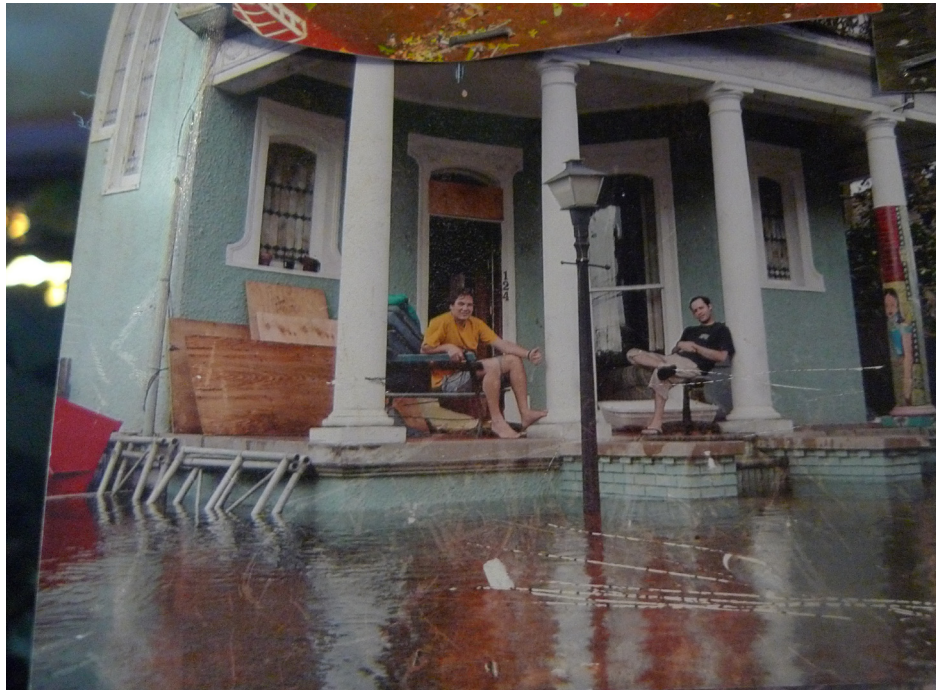
En bild från dagarna efter Katrina. Hostelet India House står nästan två meter under vatten.

- En stor del av den svarta befolkningen återvände aldrig till New Orleans, säger syster Vera på The Rebuild Centre