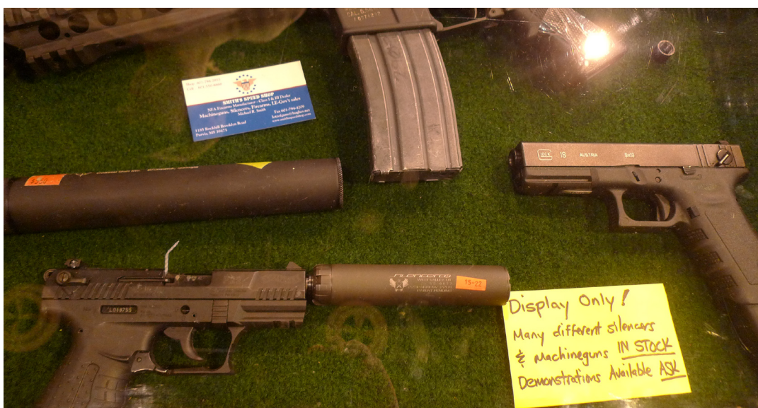
Många amerikaner äger fler vapen än de hunnit avloss skott med.