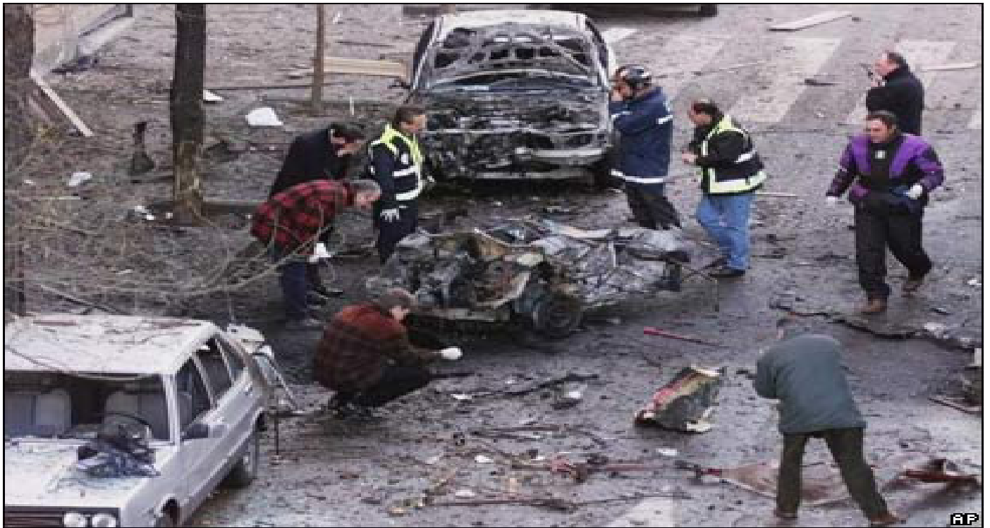
Löjtnant Pedro Antonio Blanco mördades den 12 januari 2000 av ETA. En bilbomb hade placerats under hans bil.