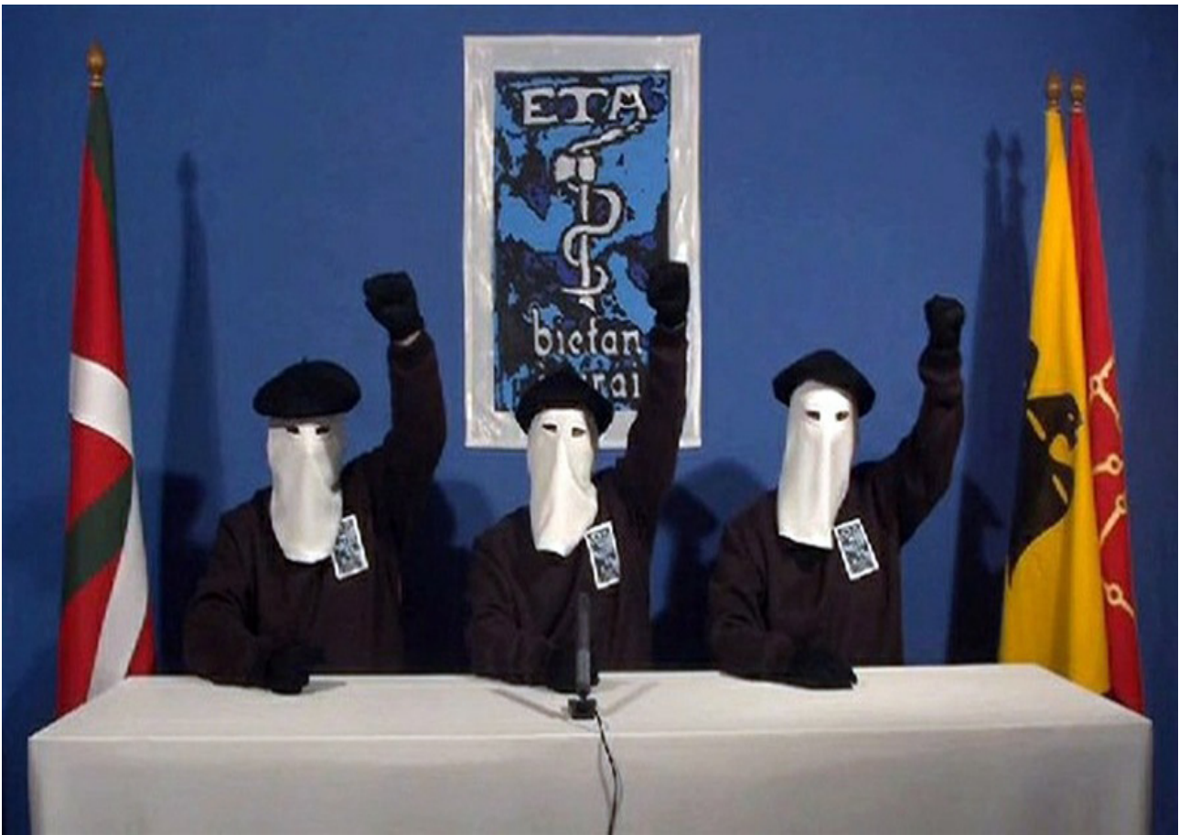
Det tog inte lång tid innan nyheten om ETA:s definitiva slut nådde omvärlden. Källa Gara.