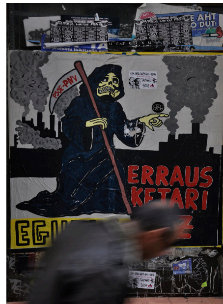
En man passerar en graffitimålning i San Sebastian. Budskapet lyder: Att rösta på PSOE eller PNV är ungefär som att rösta på döden.