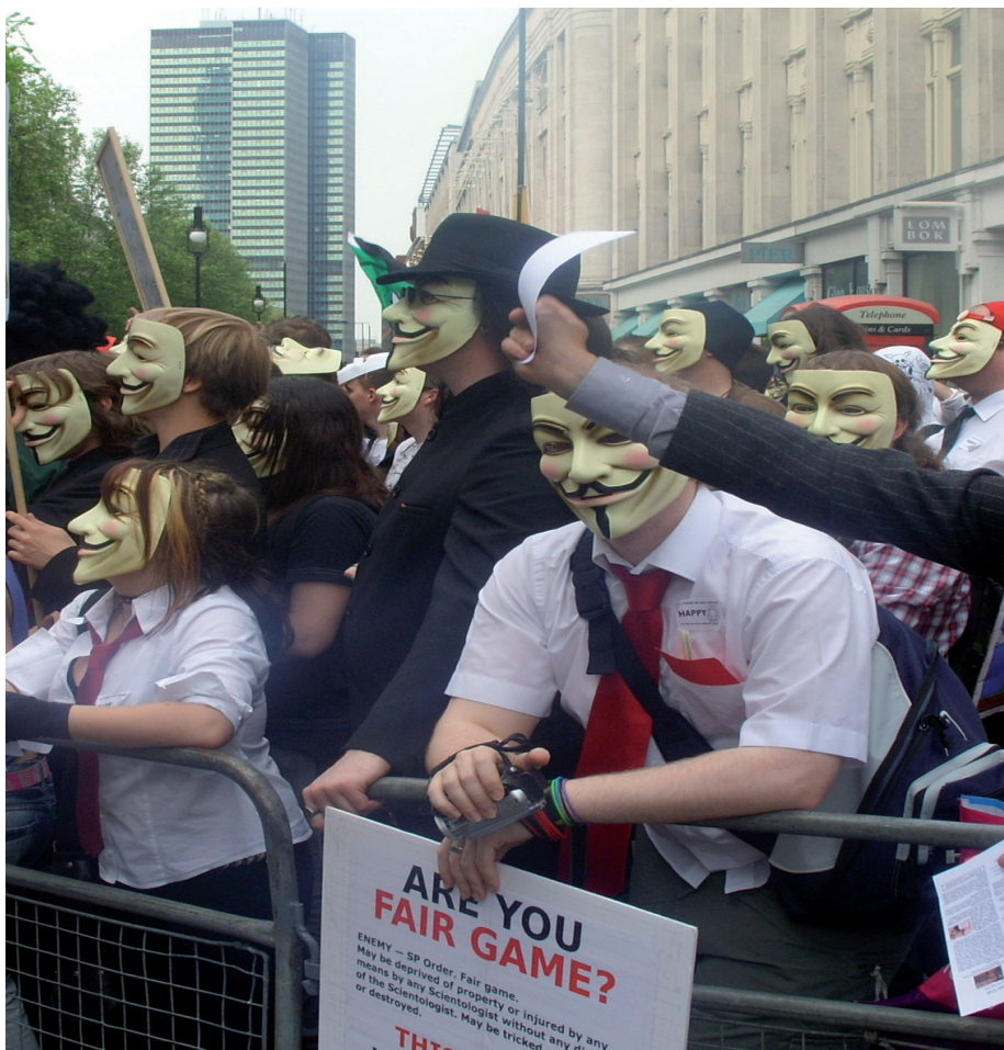
Anonymous-anhängare protesterar utanför scientologikyrkans högkvarter i Englands huvudstad London 2008.