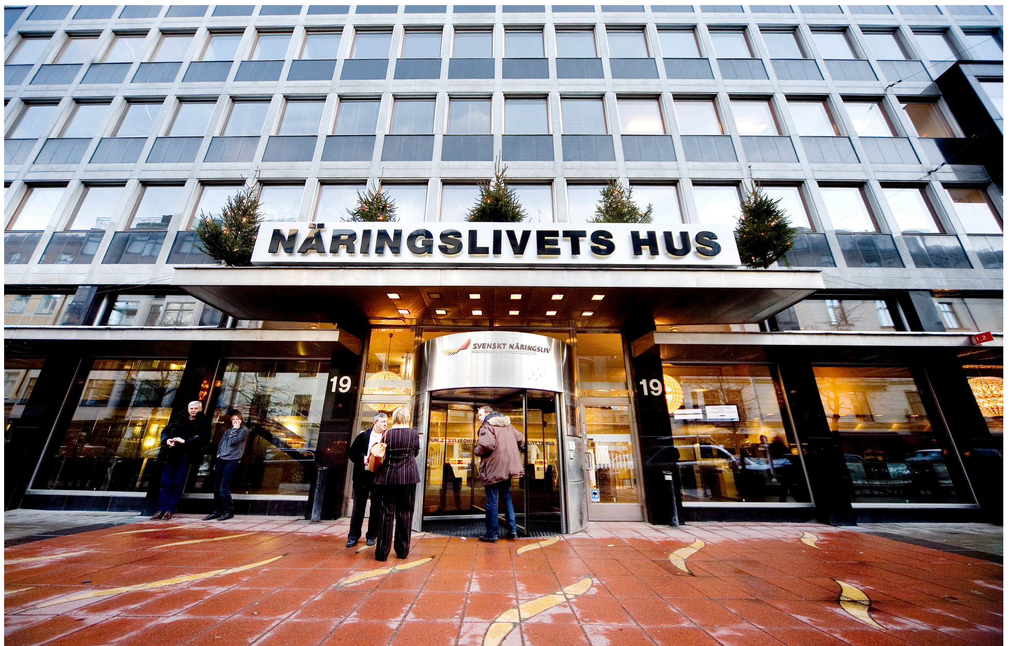
Näringslivets hus, Östermalmstorg