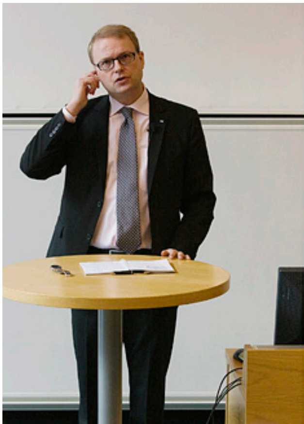
Tobias Krantz som forskningsminister

Krantz exemplifierar med en bild: en idé som kläcks i ett land med högt skattetryck riskerar att utvecklas i ett annat land, med lägre skattetryck. Skatterna måste därför sänkas och reglerna för företagare måste förbättras. Men innovationspolitik kan också, menar han, definieras i en snävare form. Det man vanligtvis menar då är hur pass bra innovationssystemet fungerar. Innovationssystemet är, säger han, bryggan mellan akademien och näringslivet.