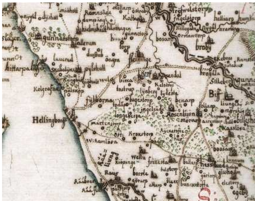
fig 1: Karta från 1684 som visar de olika centralpunkterna och vägarna som fanns i området under den tiden (Carelli 2010: 118).

Under järnåldern fanns en stor variation när det gällde gravgåvorna som människorna begravdes med. Från perioden romersk järnålder till folkvandringstid och vendeltid begravdes vissa individer med rikare gravgåvor än andra. Detta tolkas idag som att det har funnits en hierarki där vissa människor hade mer rikedom och makt än andra. Andra rika fynd pekar på handel och specialiserat hantverk och stora boplatser stärker teorin om att det har funnits hövdingar i järnålderssamhället. I östra Själland så finns det rika gravgåvor och prestigegods från det romerska riket som är från romersk järnålder och folkvandringstid, fast det finns väldigt lite av dessa fynd som har hittats i nordvästra Skåne där Helsingborg ligger. Men det finns två platser i området, Filborna och Påarp, som tros ha fungerat som lokala stormannagårdar. Under järnåldern var gården en plats där hövdingen hade hövdingadömet centrum. Dessa gårdar var centrum för de ekonomiska, religiösa och sociala aktiviteter. Gårdarna kan ha skiftat i betydelse för omgivning, det vill säga vissa gårdar hade stor betydelse för sin omgivning och vissa gårdar hade mindre betydelse. Aspeborg menar att uppkomsten av stadsliknande samhällen och markant handel under den yngre järnåldern visar på förekomsten av begynnande kungarikena (Aspeborg 2008: 105f, 108).