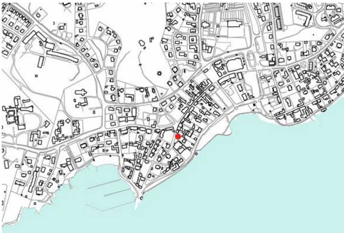
Fig.2: Markeringen visar platsen för utgrävningen av kvarteret Urmakaren 1 & 2, tomterna var belägna intill stadens Stora huvudgata samt Lilla Torget. (Sigtuna Museums Undersöknings

Inträffade det något särskild händelse i Sigtuna under denna tid som möjligtvis kan ge en rimlig förklaring till varför ugnen och byggnaden den tillhört fick tas ur funktion och eventuellt också rivs just under denna tid? Hur lång livslängd hade hypokauster vanligtvis?