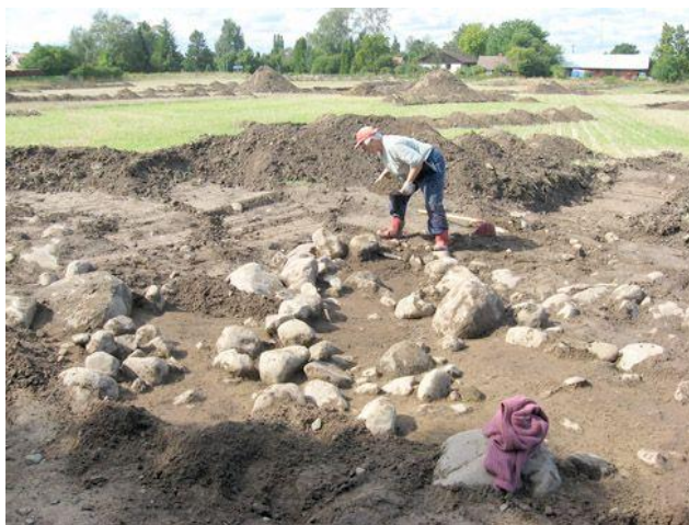
(Björnhovda, Öland.)

påverka och utforma bostadsutveckling. Alla planer och skisser på nya bostadsområden måste granskas och godkännas av kommunen, utan deras godkännande får inget byggas. Att erhålla alla dessa tillstånd är en lång och dryg process. En exploatör som intervjuats som driver ett utbyggnadsprojekt (som resulterat i över 130 nybyggda hus än så länge), beskrev kommunens inflytande över sina planer ” De har total makt ”.