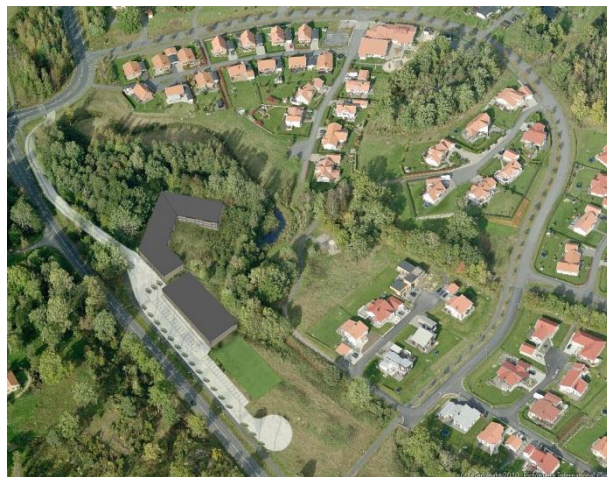
(Illustrationsbild på bostadsområde, Jönköpings kommun)

Om det önskas en mer gynnsam utveckling på bostadsmarknaden är det viktigt att invånarna i kommunen blir mer insatta i det kommunala valet. Eftersom de kommunala tjänstemännen styr samhällsutvecklingen, är det essentiellt att få en ändring av regleringar och hinder som kan bidra till att processen inte tar lika lång tid.