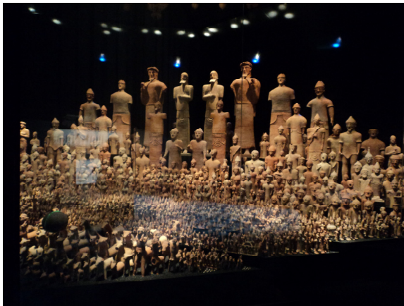
Bild 1 Ajia Irini-montern

Museet består av de permanenta utställningarna Cypern genom tiderna , Antikens Grekland och Rom , Egypten , Islamisk konst , Guldrummet , Främre Orienten och Expeditionen . Vi har valt att arbeta med de första två, eftersom dessa behandlar de områden och perioder som är mest förknippade med den klassiska antika traditionen. När vi besökte museet fanns det även en tillfällig vandringsutställning som hette Etruskerna i 3D , som utnyttjade ny teknik och som verkade välbesökt.