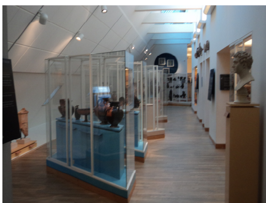
Bild 11 Del av huvudpassagen

utställningen om Grekland och Rom. Utställningen är uppbyggd som en kronologisk linje, som börjar i Egypten och slutar i det kristna Rom, med små sidorum där man har valt att presentera olika teman. Enligt översiktskartan är utställningen indelad i 20 teman. 8 Utställningen sträcker sig genom flera rum och är ganska lång och smal, utan möjliga avvikelser, och slutar med en trappa ner. Längs trapporna till nedervåningen hänger senantika mosaiker, och besökaren går även igenom ett tomt rum med sentida kejsarmedaljonger på väggarna. Enligt planlösningen är även detta en del av utställningen. Besökaren är väldigt fri att själv välja vad den vill se, då sidorummen tydligt behandlar specifika teman, och det går att främst hålla sig i huvudpassagen. Även om utställningen är kronologiskt uppbyggd så kräver den inte att besökaren går igenom allting i ordning, eftersom den sällan tar upp historiska händelser som skulle kunna göra besökaren beroende av att hänga med i texterna. Det är fullt möjligt att bara se vissa teman eller perioder utan att förlora i förståelse av texterna, då dessa är ganska fristående från varandra.