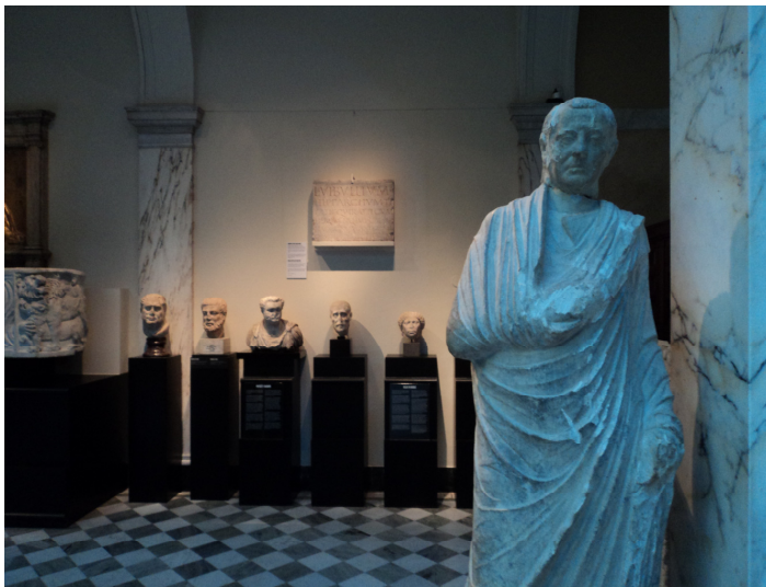
Bild 3 Porträttgalleriet

och även tematiskt indelade, och fyllda med numrerade föremål från olika tider i Cyperns historia. Alla har en längre text på sidan av montern som behandlar ämnet, samt långa föremålslistor som enbart anger proveniens. I utställningen finns en generell koppling mellan föremål och text då föremålen i montern är relaterade till textens tema, exempelvis vapen i montern Krig och koppar . Längs med väggarna står här och där större skulpturer från Cypern i vanliga glasmontrar. Alla färger i utställningen går i montrarnas mörkgröna, med svart bakgrund för föremålen, vilket fångar upp färgerna på marmorn i rummet. Utställningen har en tydlig början med en introducerande text, som besökaren bör läsa för att få en kontext, särskilt till var materialet kommer ifrån. Däremot står montrarna mer eller mindre i en cirkel, som man kan uppleva i valfri ordning utan att mista förståelse.