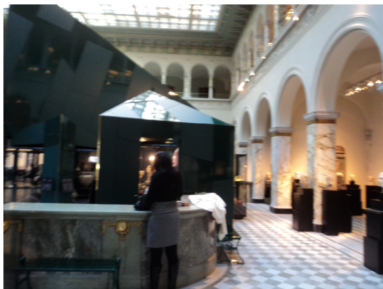
Bild 2 Centralhallen

Besökaren kommer först in i Cypern genom tiderna , som är belägen i en stor centralhall. Delar av den gamla bankinredningen, exempelvis en stor marmordisk, är kvar. Montrarna i utställningen är specialdesignade för miljön, och är stora, gröna och i oregelbundna former som påminner om klippor. Detta ger ett ovanligt helhetsintryck och skiljer sig estetiskt från många vanliga monterutställningar. Centralt placerad i rummet står den största montern, som