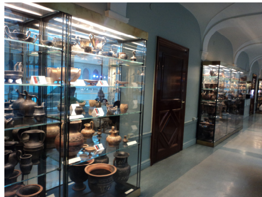
Bild 5 Studiesamlingen - keramikserie

Grekland, Rom och Egypten. Dessa är inte numrerade och är organiskt uppställda. De enda texterna finns i ett tillhörande häfte, som hänger lite avskilt på väggen, där dessa teman behandlas och vissa av föremålen skiljs ut och beskrivs. De typologiska tvärställda montrarna saknar helt förklarande text, då texthäftet bara behandlar temamontrarna. Det finns en tydlig koppling mellan föremål och texterna i häftet, då föremålen tydligt tillhör de olika teman som beskrivs. Men då bara några få föremål skiljs ut förblir majoriteten oförklarade, och dess funktion ofta inte uppenbar för besökaren. Montrarnas röriga och närmast överfyllda intryck känns lite slarvigt och slumpartat, särskilt då de helt saknar förklarande texter.