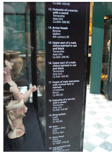
Bild 8 Föremålslista

numrerade föremålslistorna på varje monter, där det frekvent förekommer oförklarade specialisttermer och ibland engelsk terminologi för olika glasyrtyper, exempelvis ”Black slip painted I-keramik” och ”Bikrom III-keramik”. Beskrivningen av några mynt använder också numismatiska termer utan förklaring. Vi känner att detta riskerar att få besökare utan dessa förkunskaper att känna sig exkluderade, eftersom det inte finns någon förklaring till denna information någonstans. Som det nu framställs känns det som något besökaren förväntas veta, vilket inte är riktigt bra, då det inte finns någon förklaring som kan legitimera okunskaper hos de som inte förstår.