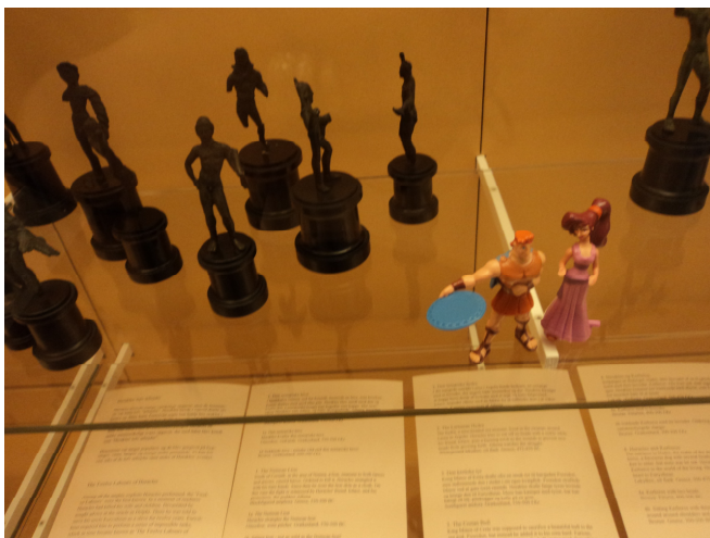
Bild 13 Herkulesmontern

Materialet i utställningen är varierande, men dock med fokus på keramik från olika perioder. Det finns även bruksföremål, skulpturer, sentida modeller och vapen, mm. I utställningens huvudpassage står främst utlyfta föremål i egna eller mindre montrar,