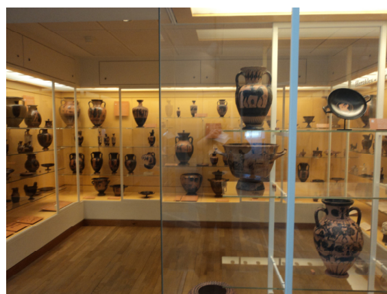
Bild 12 Sidorum

nedanför större skulpturer etc finns mindre texter med proveniens eller som behandlar kortare ämnen relaterat till monterns innehåll. Ibland finns det listor där ett urval av föremålen i montrarna beskrivs, men sällan mer än fyra stycken åt gången. Text och föremål samspelar väl, och det är mycket sällan som det känns orelaterat eller tveksamt vad deras relation är till varandra.