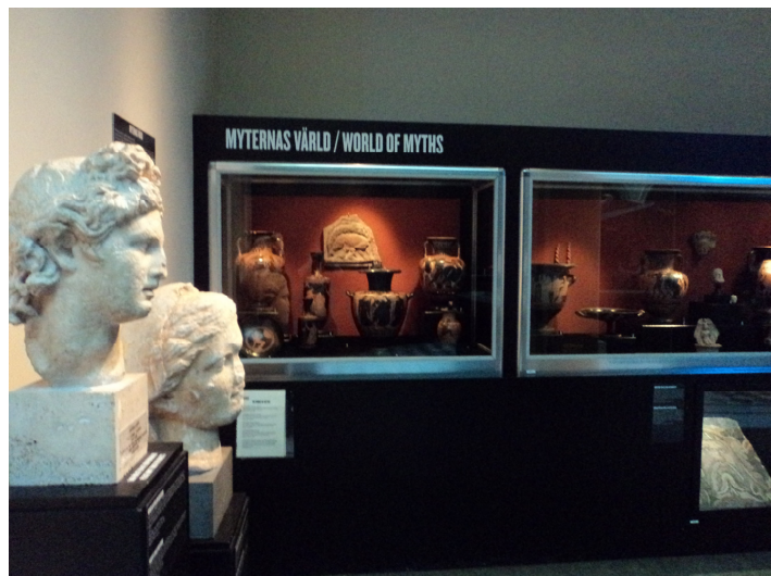
Bild 4 Antikens Grekland och Rom

och delar av marmorfriser på väggarna mm. Det finns enbart en längre text: om porträttbrukets historia, främst rörande Rom. I övrigt finns det korta texter till föremålen, mest om inskriptioner eller beskrivningar av bysterna. Det står även några större marmorstatyer på andra platser i rummet, exempelvis på varsin sida av ingången.