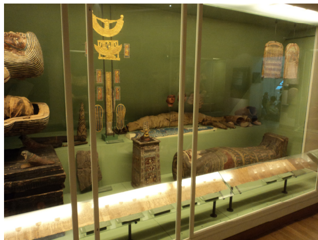
Bild 14 Monter i Osiris' Rige

De egyptiska rummen utmärker sig genom att materialet där är lite mer dramatiskt presenterat: Mumierna är uppställda tillsammans med gravmaterial och högar av färgglada ushabi-figurer, med De dödas bok i förgrunden. Vi känner det som att det är tänkt att skapa atmosfären av en gravkammare.