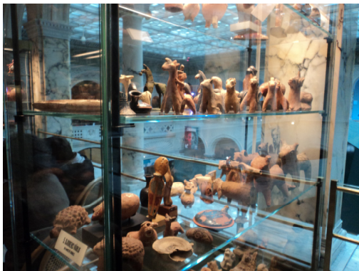
Bild 6 Studiesamlingen - temamonter

I det övre galleriet finns studiesamlingen, som består av flera montrar längs ena väggen samt tvärställda montrar mellan kaféborden. Montrarna längs väggen är fyllda till brädden med rader av typologiskt ordnad keramik från Grekland, Rom och Etrurien, med enstaka etiketter om stil och period. De tvärställda montrarna är indelade efter sex olika teman: Bilden av människan, gudarnas värld, lust och fägring, bröd och skådespel, djurens värld, upplysning - ljus och skrift. I dessa har man blandat varierande föremål från olika perioder i