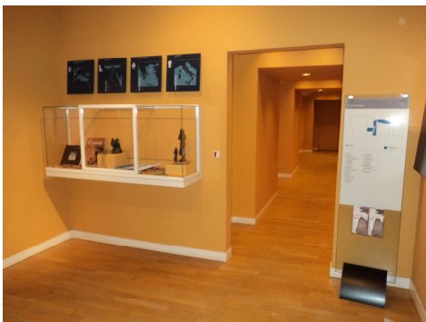
Bild 9 Entré till Antiksamlingen

på museet är det ordentligt skyltat, tillsammans med bl. a. en sarkofag, till Antiksamlingen en trappa upp.