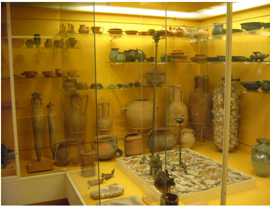
Bild 15 Hörnmonter i sidorum

förkunskap, till exempel förklaras i ett och samma rum vad en kentaur är, men inte en menad.