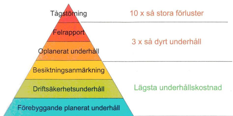
Figur 3. Driftsäkerhetspyramid (Corshammar, 2005)

driftstörningarna. Många förvaltare felprioriterar och ägnar resurser åt administrationen istället för att analysera driftstörningarna korrekt, ofta kan det bara vara små petitesseer i budgeten som hindrar de bästa lösningarna. (Corshammar, 2005) När det gäller driftsäkerhet kan man se Nederländerna som ett föregångsland. I Nederländerna har man kalkylerat på kostnaderna för driftstörningar samt de straffavgifter som måste betalas till tågoperatörerna då man inte kan leverera en fullt fungerande bana. Med denna kalkylering blir det enklare att motivera och prioritera kostnaderna för underhållet (Corshammar, 2005).