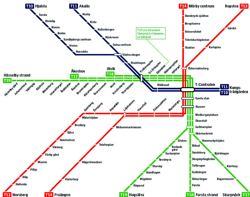
Figur 1. Stockholms Tunnelbanenät (SL, 2010)

Stockholm har totalt 100 tunnelbanestationer, fördelade på tre olika linjer, röda, gröna och blå, se figur 1. Alla linjer möts vid T-centralen där även SJ:s centralstation för den nationella tågtrafiken lättast nås. Tunnelbanesystemet drivs i regi av Storstockholms Lokaltrafik, SL. Hela tunnelbanenätets totala längd är 105,7 kilometer. Stockholms tunnelbana invigdes 1 oktober 1950, då var det sträckan Slussen – Hökarängen som invigdes. Gröna linjen byggdes sedan vidare under 50-talet och blev färdigställd 1960. Linjen förlängdes sedan med sträckan Bagarmossen – Skarpnäck år 1994. Röda linjen byggdes under 60- och 70-talet, den blåa linjen byggdes under 70- och 80-talet (Alfredsson et al., 2007).