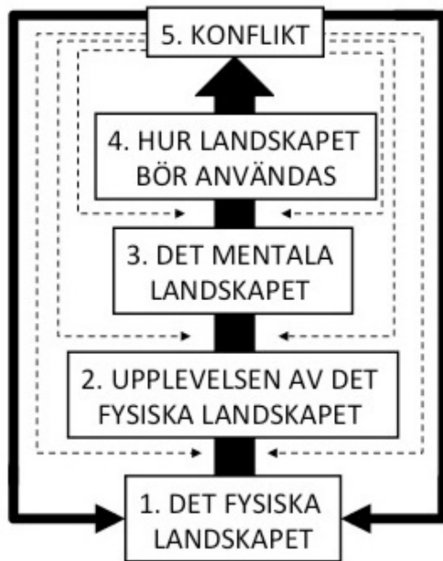
Figur 3. Grafisk figur över hur det fysiska landskapet formas av upplevelsen av landskapet samt att konflikten driver utvecklingen av landskapet framåt. Grafik, Wösel Thoresen 2012

För min förståelse av Mitchell, Duncan & Duncan och Crang har jag har skapat en figur, se figur 3, som skall visualisera teorin. Nederst i ruta ett finns det fysiska landskapet. Ruta 2 representerar olika individer och kollektivs upplevelser av det fysiska landskapet. Upplevelsen av det fysiska landskapet skapar ett mentalt landskap, ruta tre. Ruta två och tre står i relation till den individ eller samhällsgrupp som upplever landskapet. Det mentala landskapet kan, beroende på de olika upplevelserna av ett landskap, skilja sig markant mellan individer och samhällsgrupper. Den mentala bilden, ruta tre, formar sedan bilden av hur det fysiska landskapet skall användas, ruta fyra. Bilden av hur landskapet bör användas återskapas sedan i det fysiska landskapet. Konflikt kan uppstå på alla nivåer, i både modellen och i verkligheten. Konflikt skapas i