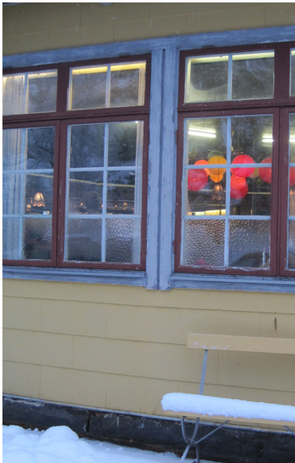
Trots snö och kallt väder lockar folkparken med värme och gemenskap.