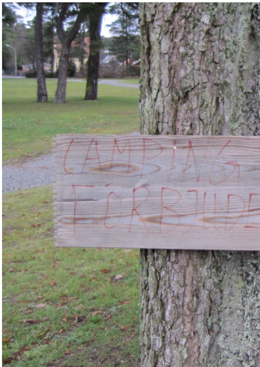
När Åhusparken fortfarande var igång var ett stort problem med att många plankade in. Runt hela parken fanns plankor som försvann, bland annat bysterna på Per Albin Hansson, Hjalmar Branting och på parkens föreningshus.