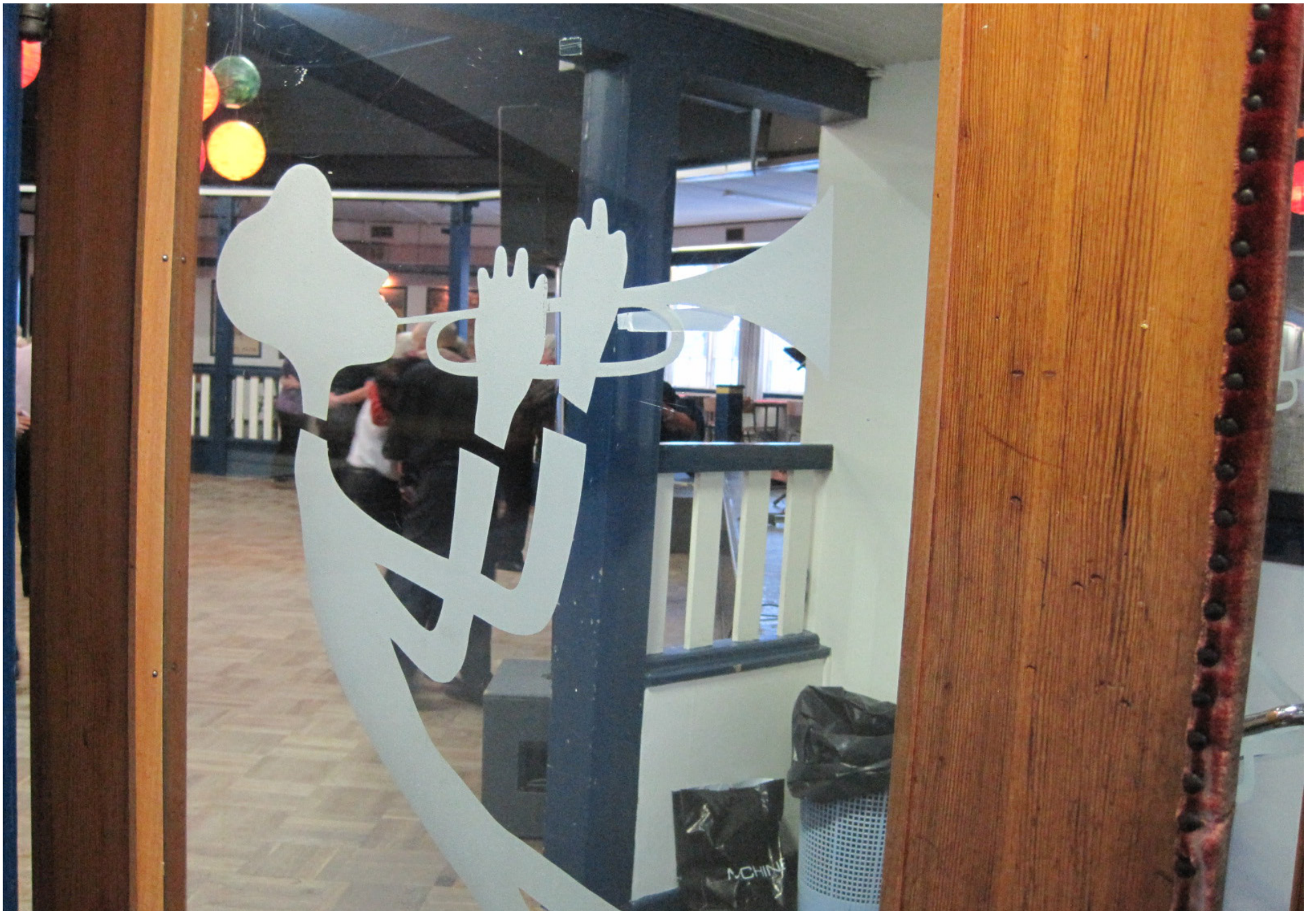
Pensionärerna dansar på i Glimåkra Folkets park. Något större företroende för den typen dans som ungdomarna håller på med har de inte. Håller man inte om varandra har PRO Osbys medlemmar svårt att se tjusningen i det hela.