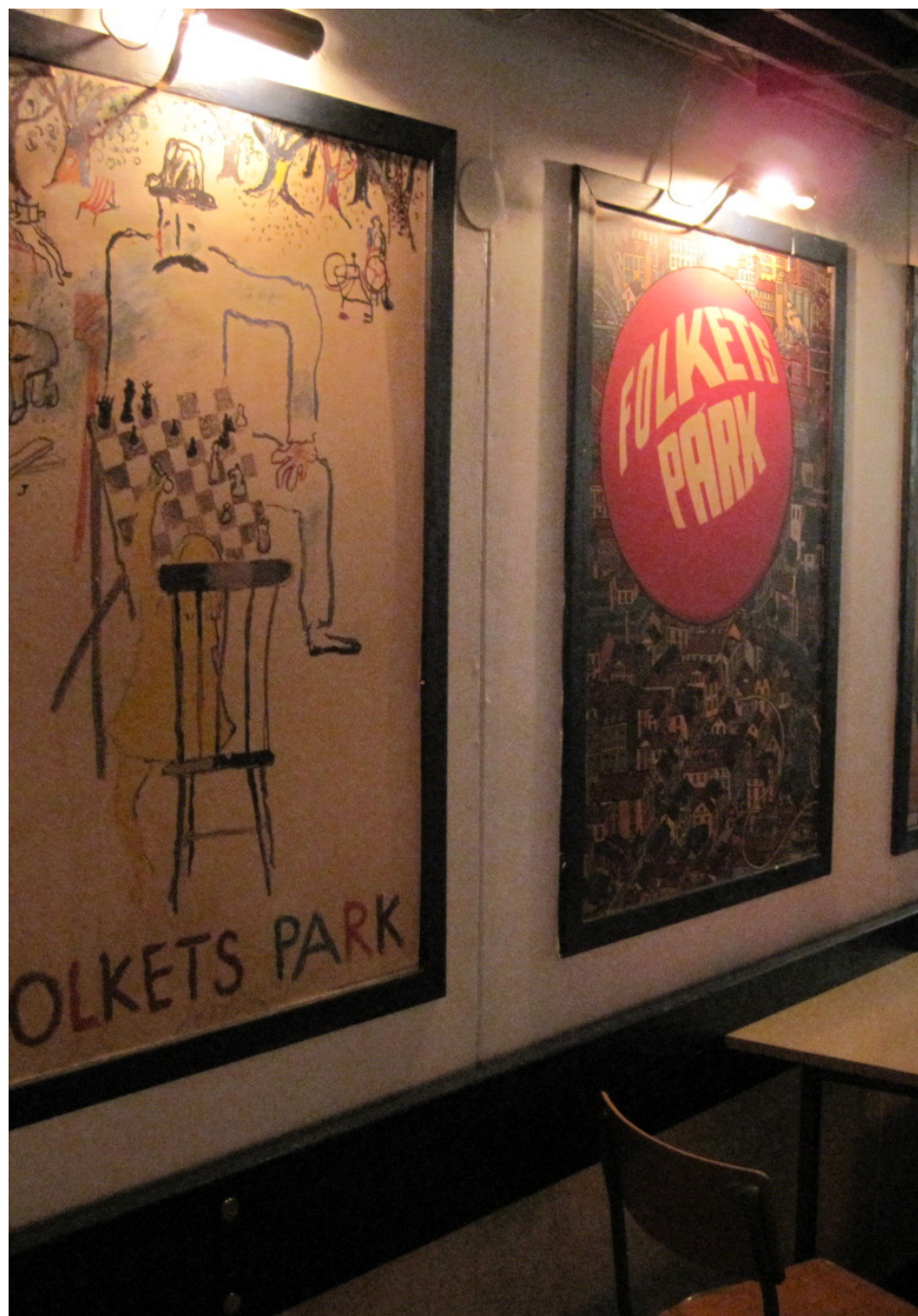
Nostalgin finns både på väggarna och på borden. Men dansgolvet lockar mer än