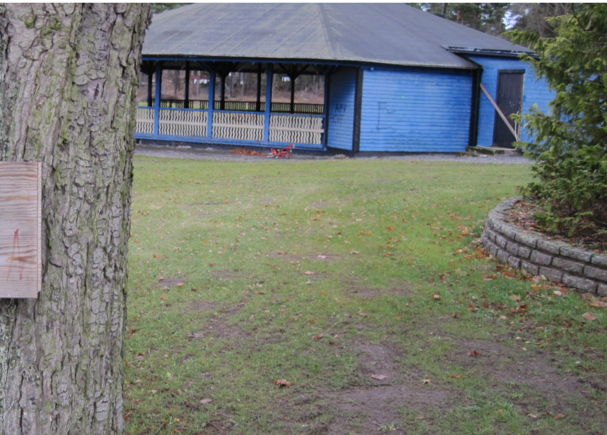
...la området fanns det staket och ungdomarna såg det som en utmaning att ta sig in. När parken gick i konkurs togs staketet bort och det sjangserade väldigt fort. Mycket av det som fanns första föreståndare J F Palmér.