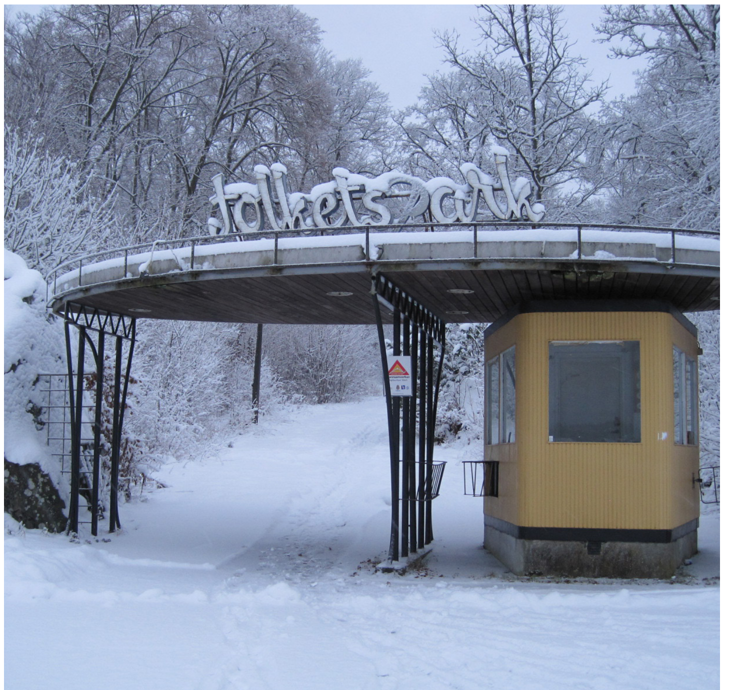
Glimåkra Folkets parks ingång är kulturmärkt men används förtillfället inte, då det regnar in genom taket.