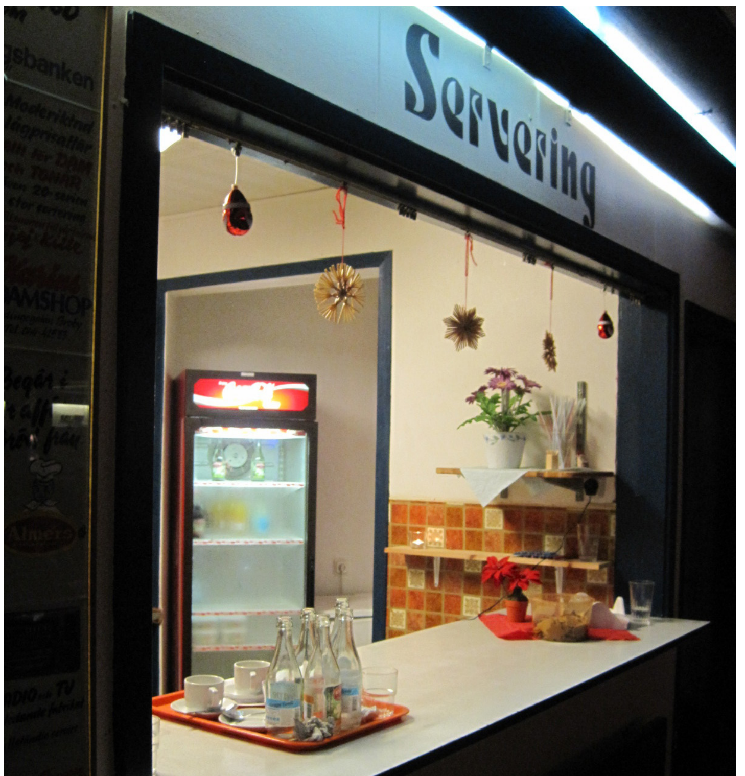
Kylskåpet gapar tomt. Under en danskväll går det åt massor med dricka.