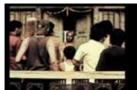
Ur Breakthrough's kampanj Ring the Bell som ville få folk att ingripa när de hörde en man misshandla sin fru.