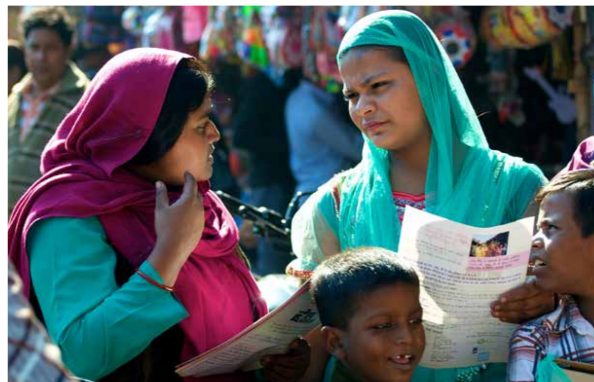
Opinionsbildning och information är syftena när Mailrunnigha, till vänster, på organisationen Breakthrough kampanjar på marknaden. Här träffar hon en kvinna vars man misshandlar henne när han har druckit.

Fakta i artikeln är hämtade från "In pursuit of Justice. UN Progress of the World's Women 2011-2012", "Trust Law Danger Poll." och Unicef.