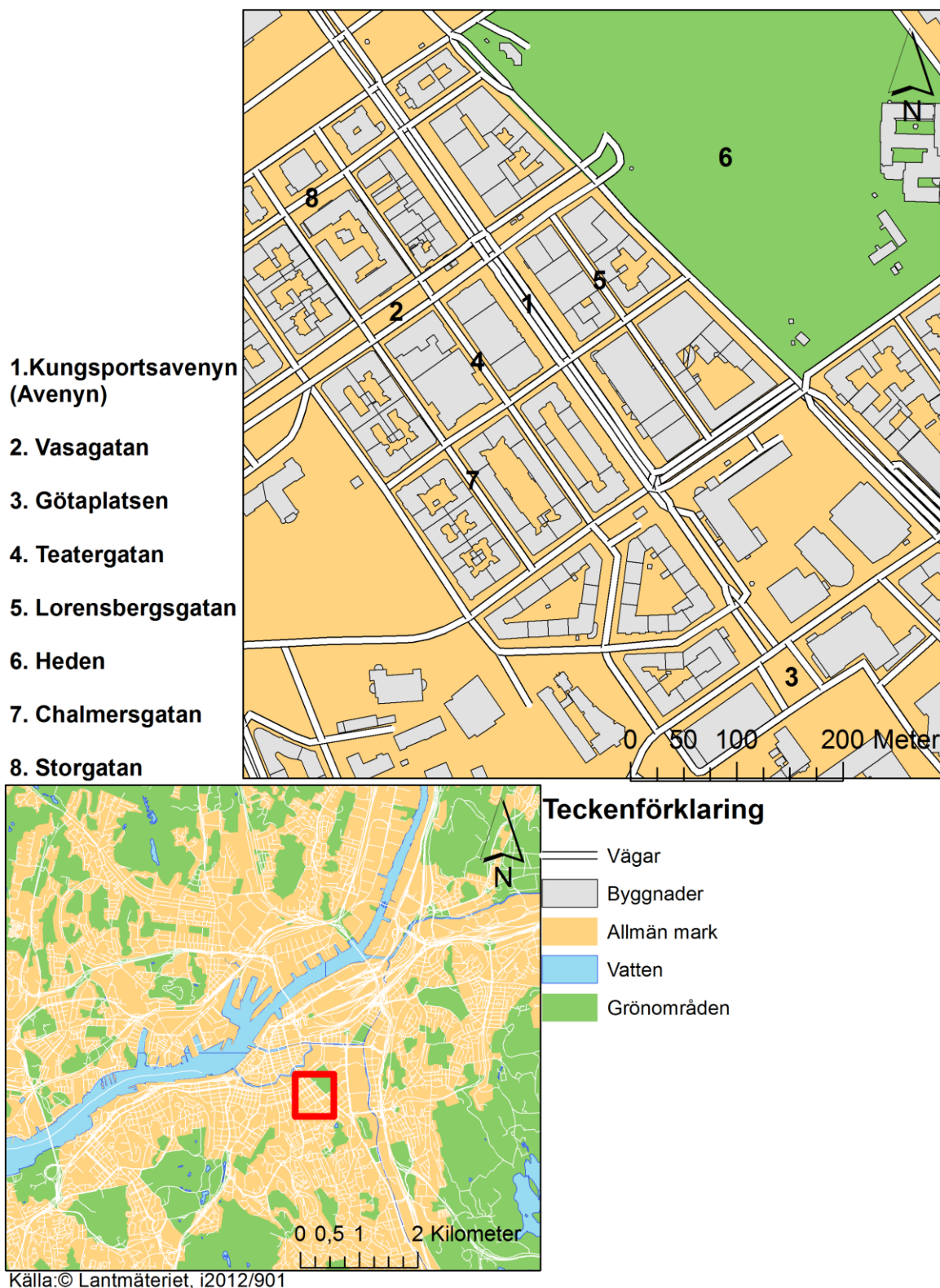
Figur 1: Karta över Göteborg där Avenyområdet har zoomats in. Utmarkerade gator och platser som förekommande i uppsatsen.