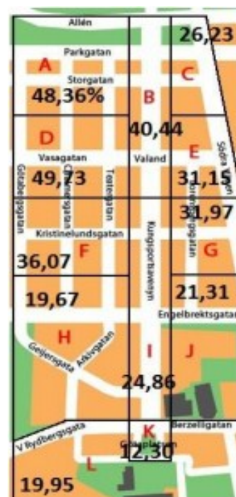
Figur 2: Andel i procent som upplever ett område otryggt i Avenyområdet.

I enkäten fick de boende svara på vilka problem de ansåg vara värst. Nedskräpning och urinering var enligt enkäten de värsta. Det var 58 % av respondenterna som ansåg urinering vara ett stort problem och 50 % ansåg nedskräpning vara ett stort problem.