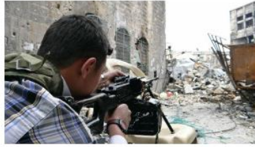
أكد المرصد السوري ان اشتباكات عنيفة تدور داخل وخارج المسجد الاموي

وفي محافظة ريف دمشق قتل 24 مواطناً بينهم ستة من أفراد المعارضة، وفي محافظة دمشق قتل 15 مواطناً بينهم ثلاثة أطفال و10 من أفراد المعارضة خلال اشتباكات مع القوات النظامية وقصف تعرض له حي جوبر.