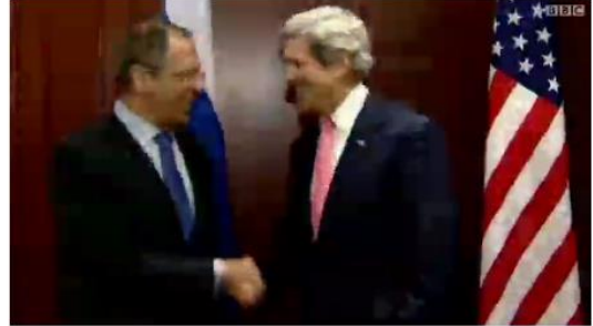
اعرض الملف في مشغل آخر

آخر تحديث: الأربعاء، 27 فبراير / شباط، 2013، GMT 00:03