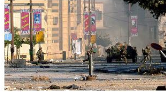
اشتباكات بين قوات الحكومة السورية ومسلحي المعارضة في مناطق بحلب

آخر تحديث: الجمعة، 22 فبراير/ شباط، 2013، 18:28 GMT