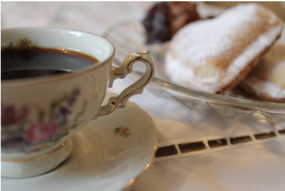
Bild 3 – Guldkantad kaffekopp, pressat glas, broderad duk, nöttoppar och vaniljhärtan på kafferep.

ligheten att fotografera kafferepet och lägga ut på internet exempelvis är mer en självklarhet. På samma sätt som Linas 1990-tals lägenhet kunde bortses ifrån kan andra saker bli osynliga. Huvudsaken är att de andra deltagarna på kafferepet delar uppfattningen om vad som värdesätts och hur det skall tillges mening, oavsett om det handlar om vad saker skall symbolisera eller om det handlar om vad som kan bortses ifrån (mobiltelefoner, kameror) när det kommer till att uppleva kafferepet som autentiskt.