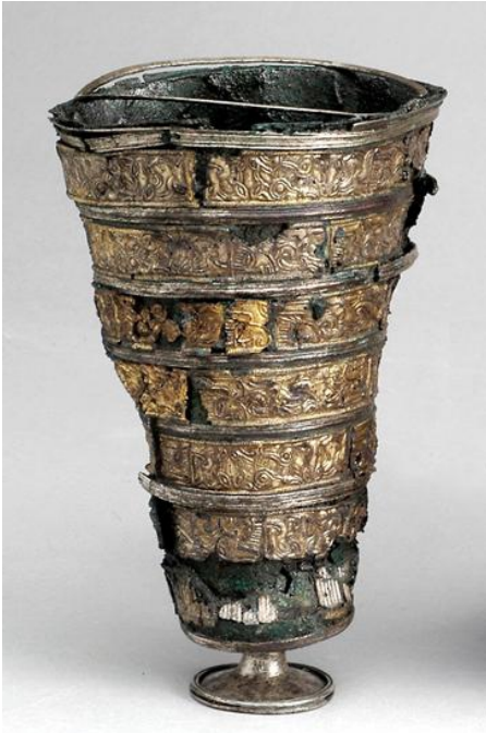
Figur 2.

När det så kallade kulthuset i Uppåkra grävdes ut hittades inte bara guldgubbar utan även bland annat en bägare (se figur 2) som fått mycket uppmärksamhet i de texter som skrivits om Uppåkra och dess fyndmaterial (Ödman 2003: 92). Bägaren är gjord av kopparlegering med inslag av både guld- och silverband. Dekoren föreställer både djur och människor och bägaren är ungefär 16.5 centimeter hög (Hårdh 2004: 52f). ”Uppåkrabägaren”, som den brukar kallas, beskrivs ofta i texterna som berör den som ett spektakulärt och unikt fynd (Hårdh 2004:88).