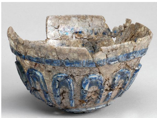
Fig 3.

En av de tolkningar som brukar göras av ”Uppåkrabägaren” är att den föreställer de dryckeskärl som Valkyrior bar (Larsson & Hårdh 2006: 180). De så kallade Valkyriorna har påträffats som fragment av fynd i Uppåkra och har tolkats avbildade kvinnor i nordisk mytologi som räcker fram dryck i bägare som liknar Uppåkrabägaren till fallna hjältar i Valhall (Larsson & Hårdh 1998: 19). På de gotländska bildstenarna avbildas också ofta en kvinna med ett kärl vilket lett forskare till att tro att det kan vara möjligt att den ska föreställa en valkyria. Att dessa bägare anses likna Uppåkrabägaren i kombination med att den påträffades i det så kallade kulthuset har detta ofta lett forskare till tolkningen att denna