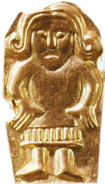
Figur 1.

centralplatser men som inte för den sakens skull anses vara föremål förknippade med prestige och kult (Stolt 2001: 31).