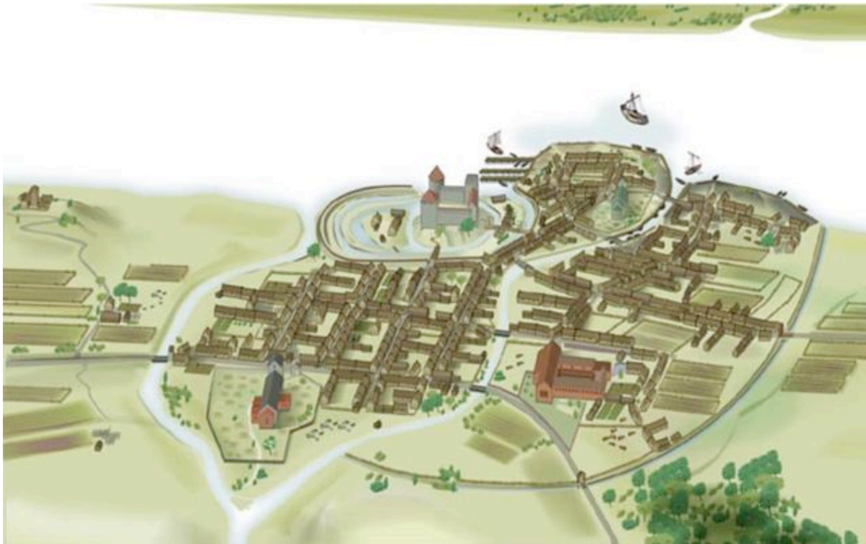
Figur 5. Illustration av Petter Lönegård av Lödöse på 1300-talet ur Claes Thelianders "Det medeltida Västergötland", 2004 s. 100-101.