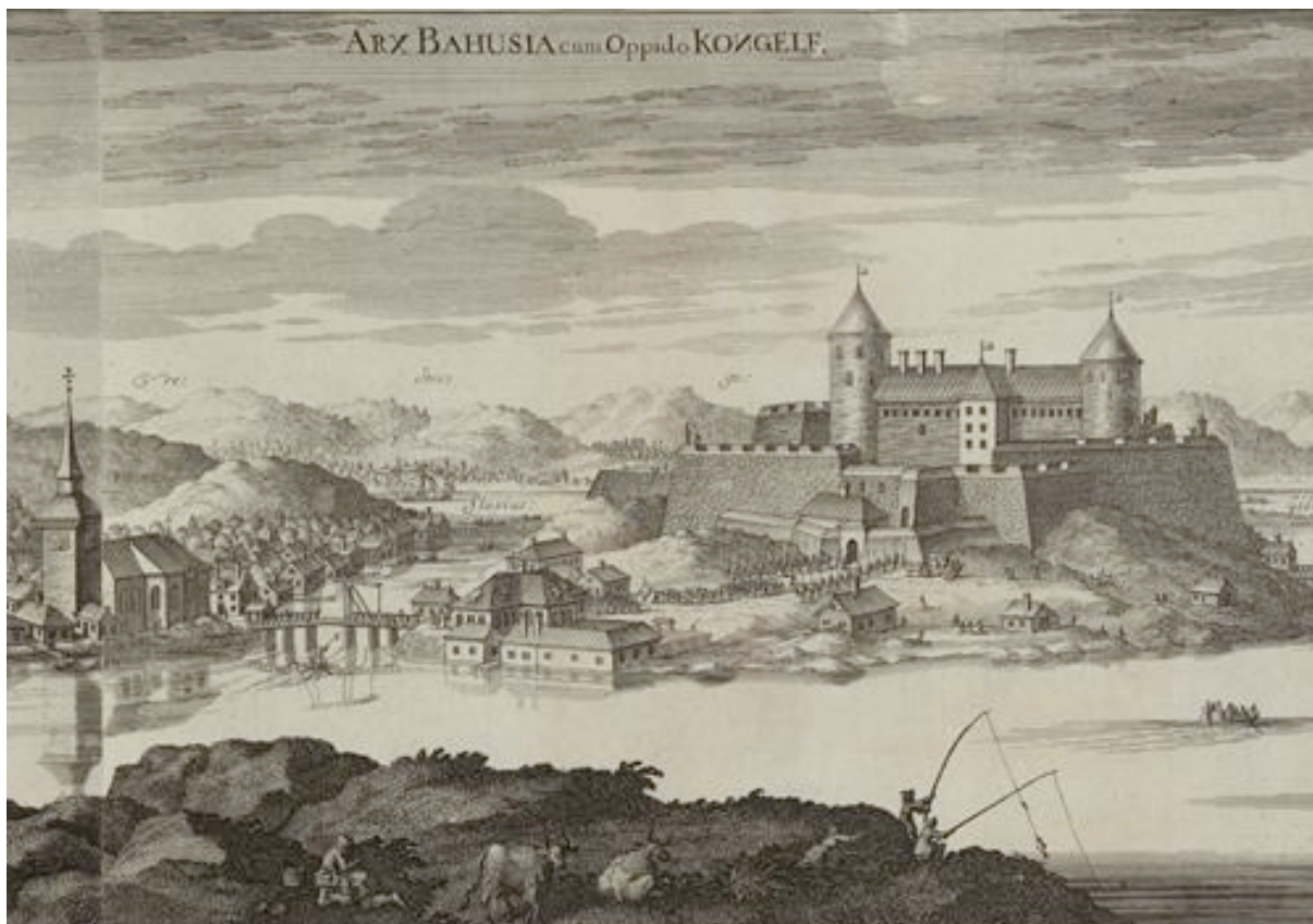
Figur 3. Målning av Bohus fästning med staden på Fästningsholmen samt kyrkan på fastlandet. Ur: Suecia antiqua et Hodierna, tredje bandet ( http://www.kb.se/samlingarna/Kartor-bilder/Suecia-antiqua/tredje-bandet/Bohus-fastning/ ). Godkänd för publicering.