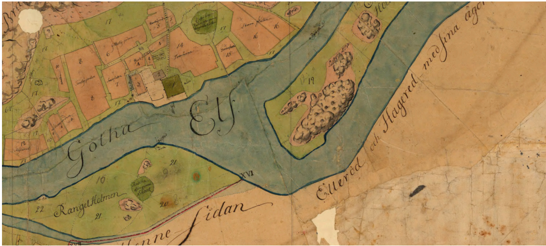
Figur 1. Den tidigaste kartan från 1750 över Kungahällas område samt Ragnhildsholmen. Lantmäteriets historiska kartor.