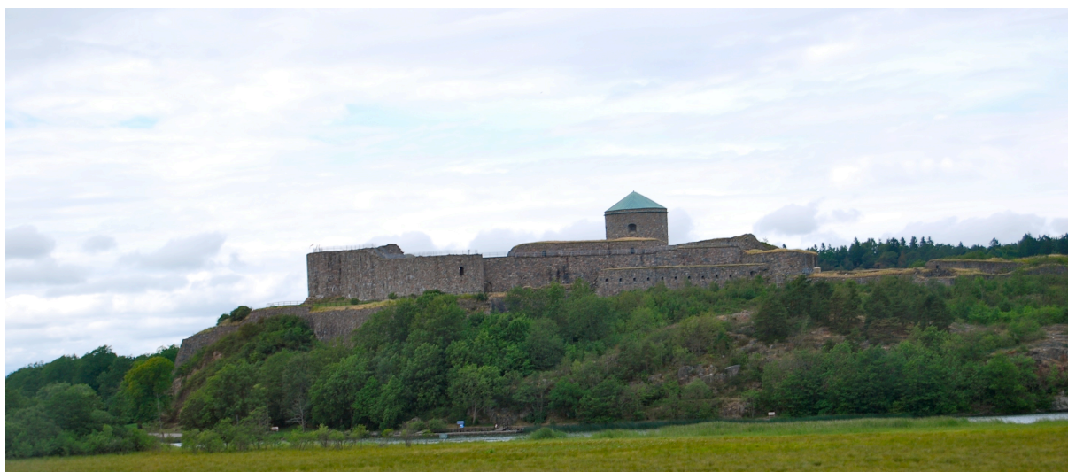
Figur 4. Bohus fästning med älven nedanför. Foto: författaren, 2009.