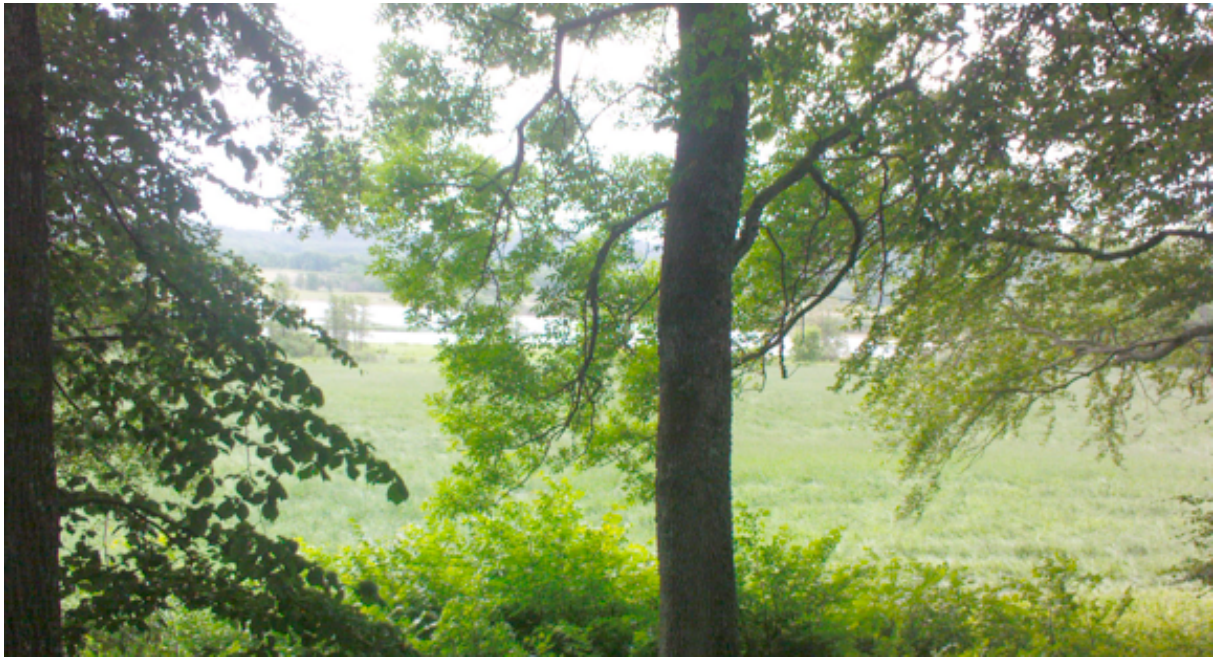
Figur 2. Utsikt från Klosterkullen i Kungahälla mot stadsområdet, Nordre älv och Ragnhildsholmen. Foto: författaren, 2011.