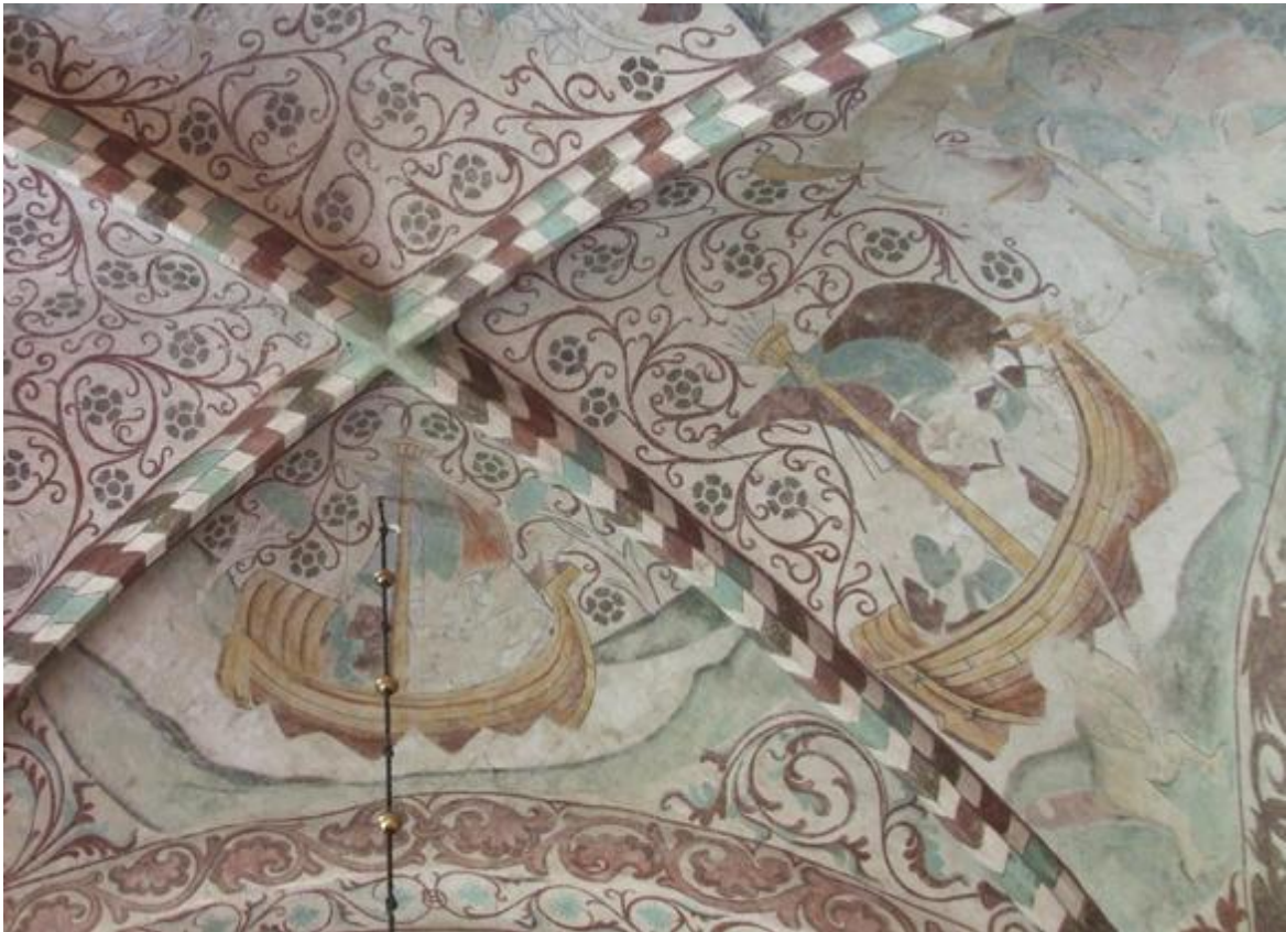
Figur 6. Olavs seglats. Takmålning av Albertus Pictor i Lids kyrka, Södermanland. Foto beskuret ( Wockatz 2008).

Att veta vem som instiftade Olavsaltare eller Olavsskulpturer är inte lätt eftersom att de historiska källorna inte alltid finns kvar. Det har ofta argumenterats att Olav har använts som en symbol för kungamaktens position eller som propaganda för en viss kung. Dessutom har bilder av olika kombinationer av Skandinaviens tre helgonkungar, Olav, Erik och Knut, ofta tolkats som symboler för unionsbildning mellan de nordiska länderna. Lidén skriver i sin avhandling att det förvisso är troligt att det från kungligt håll har gjorts försök att använda bilden av Olav den helige som propaganda, men att denna funktion har varit sekundär. Olavskonsten var i första hand ett redskap inom liturgin. Hur Olav avbildades inom den sakrala konsten ger ingen antydning till att det förekom en maktkamp mellan kyrka och kungamakt. Han framstår istället som en konung av både världslig och himmelsk härkomst, en konfliktlös blandning av de båda (Lidén 1999, s 261, 265, 268f). Detta kan också betyda att kyrkan i och med Olavsmotivet ville sprida en idealbild av en kristen och from furste, en man som satte guds ord framför sin egen vilja. I Passio Olavi står det till exempel att Olav älskade fred, men ej rädde att strida när det gällde att vara Guds ord till lags och att sprida rättvisa (Erlendsson 1930, s 16, 18). Likaså är det mycket tänkbart att kungamakten använde sig av Olav som en symbol för sin egen Gudomliga rätt till tronen. Att Olavskonsten i första