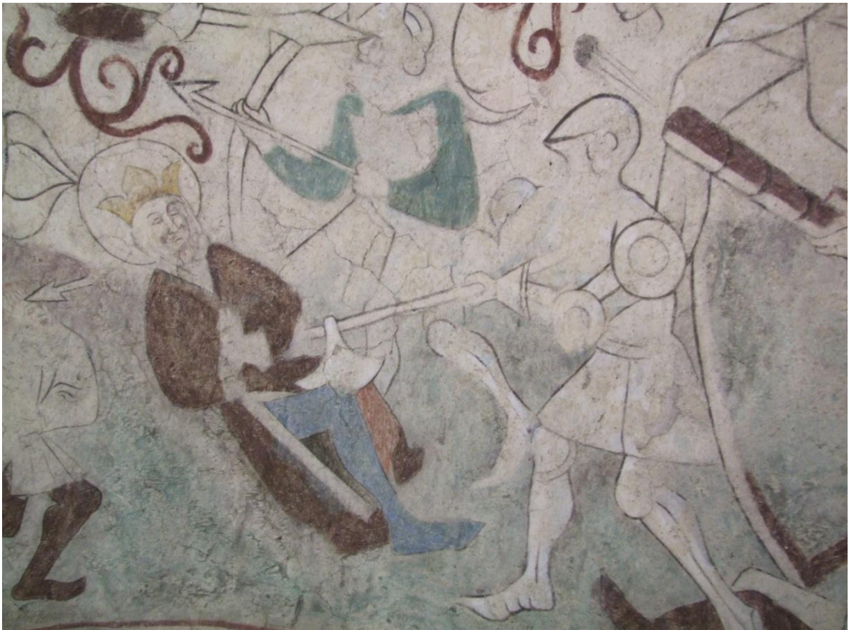
Figur 2. Olav den heliges fall i Stiklestad. Takmålning av Albertus Pictor i Lids kyrka, Södermanland (Wockatz, 2012).

Olav såg ganska snart chansen att återvända till sitt forna kungarike då Sven, Knuts oäkta son som blivit satt till att styra över Norge under sin far, blev opopulär bland den norska befolkningen. Olavs oäkta son Magnus hade följt sin far på resan till Kiev, och Olav lämnade honom hos Ingegerd och Jaroslav när han reste tillbaka västerut. De historiska källorna är bristfälliga och vi vet inte säkert hur hans färd tillbaka till Norge gick till, men år 1030 infann han sig hos den svenske kungen Anund, den bortgångne Olof Skötkonungs son, och därmed bror till Astrid och Ingegerd. Där utökade Olav sin hird med svenska krigare. Denna trupp tog han med hemåt mot Norge för att återta sitt land, men i Stiklestad mötte han motstånd i form det norska landskapet Trøndelags samlade bondehär. Där stod det slag som skulle komma att leda till Olav den heliges död. Enligt Passio Olavi skulle slaget vid Stiklestad ha stått den 29:e juli år 1028, men enligt Sturlassons Olavssaga skall slaget ha sammanfallit med en