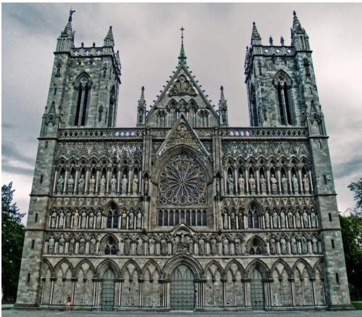
Figur 3. Nidarosdomens västfasad (Drabløs 2006).

fick kungen helgonförklarad, och redan 1060 finns en engelsk liturgisk text för Olavsmässan som firades årligen vid Olavs dödsdag. Det var alltså Grimkel som sådde Olavskultens frö, och påbörjade det som skulle bli Olavs martyrlegend. Flera skalder bidrog till att sprida och utforma berättelserna om Olavs mirakler och martyrdom, till exempel den isländske skalden Sigvat vars verser Sturlasson använder sig av genom hela Olavssagan, och berättelserna om Olavs helighet sammanställdes av ärkebiskop Øystein (1168-1188) i Passio Olavi (Seierstad 1930, s 5; Andersson 1989, s 39; Lundkvist 1997, s 161f; Sturlasson 1997, s 43f, 337ff).