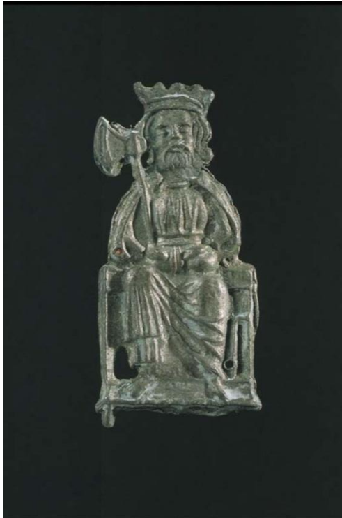
Figur 7. Pilgrimsmärke av bly från 1475, föreställande Olav den helige. Funnet i Sånga kyrka, Ångermanland (Lundberg 1998).

Bland pilgrimsmärken från 1300-talet representeras dock dessa orter allt starkare, och platserna kan nu ha blivit slutmålet för fler skandinaviska vallfarare, speciellt eftersom att det verkar ha skett en nedgång i resorna till Santiago de Compostela (Andersson 1989, s 161).