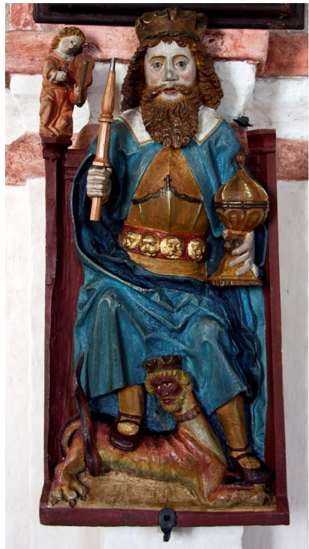
Figur 5. Skulptur av Olav den helige med glob, yxa och underliggar, från ca 1510 i St Olofs kyrka i Skåne (Castor 2010).

Olav den helige porträtterades vanligen med en gyllene krona och en helgongloria. Han bar ett riksäpple eller en spira i ena handen för att symbolisera hans kungliga ställning. I bilderna fanns också hans martyrvapen: stridsyxan. Oftast är hans hår rött eller brunt så som i sagorna, eller ibland förgyllt. Helgonkungen målades eller skulpterades ofta med ett allvarligt