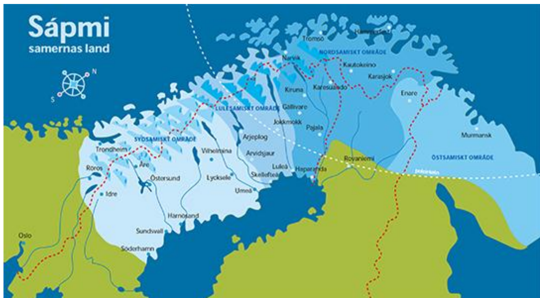
Karta över Sápmi. Karta av: Anders Sunesson

Jokkmokk ligger inom Sápmi som är samernas land vilket sträcker sig över Nordskandinavien och Kolahalvön. I Sveriges grundlag erkänns samerna som ett folk och samerna har internationellt erkända ursprungsfolksrättigheter. Ursprungsfolk är enligt FN:s definition de folkgrupper som bodde i ett geografiskt område vid tiden för erövring, kolonisation eller fastställande av nuvarande statsgränser. Folkgrupperna ska även ha bevarat delar av sina sociala, ekonomiska, kulturella och politiska institutioner för att erkännas som ursprungsfolk (Lundmark 2008: 7). Den internationella arbetsorganisationen ILO antog år 1989 konventionen 169, kallad ILO 169. Det är det enda juridiskt bindande dokument som FN antagit som endast handlar om ursprungsfolks rättigheter. ILO 169 kräver att ursprungsfolkens äganderätt och besittningsrätt till den mark de traditionellt innehar erkänns. Svenska staten har inte ratificerat konventionen då den sägs vara oförenlig med svenska rättsförhållanden. Vid en ratificering skulle samerna inom Sverige få en starkare rätt till sitt land (Lundmark 2008: 242). FN:s kommitté för avskaffande av rasdiskriminering har kritiserat regeringens hantering av samiska frågor. Kommittén uppmanar Sverige att göra ändringar i lagstiftningen för att ge samerna större inflytande över sin mark. Nyligen kritiserade även diskrimineringsombudsmannen Agneta Broberg Sveriges samepolitik och hon uttryckte att det saknas lagstiftning som säkerställer samernas rättigheter (Swahn 2013).