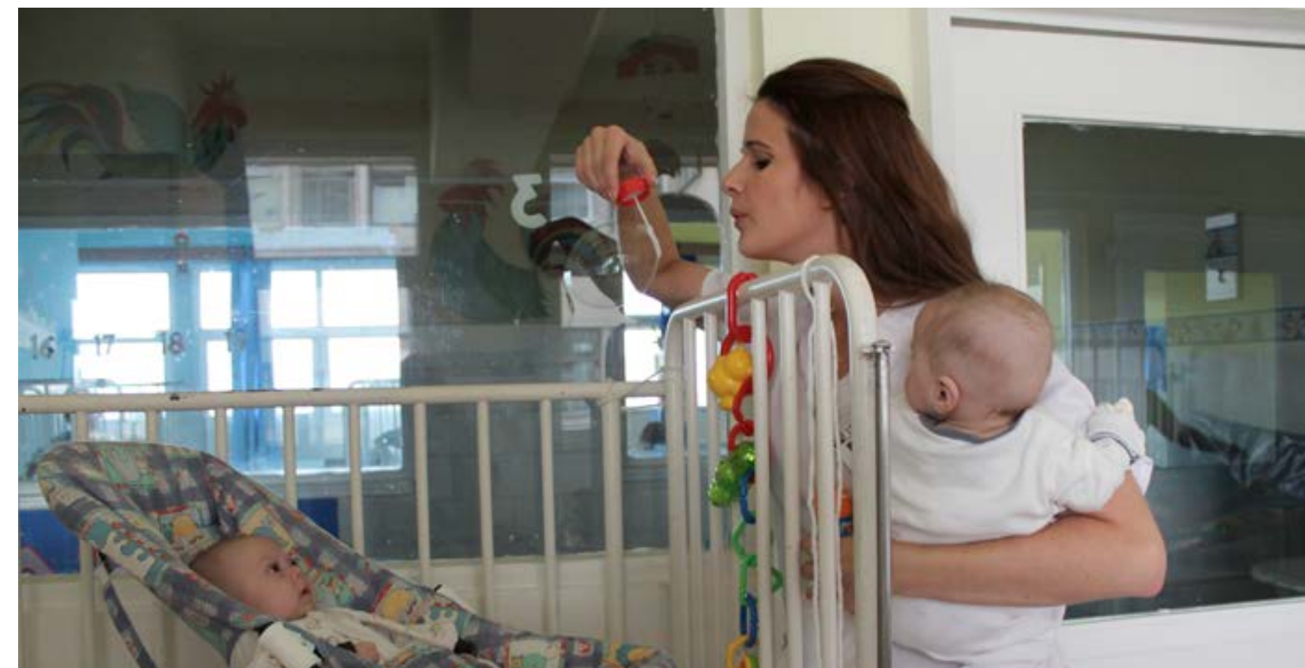
Såpbubblor är ett populärt inslag och när barnen är fler än volontärerna är de ett effektivt sätt att roa flera barn samtidigt.

Även om många familjers boendestandard har för-