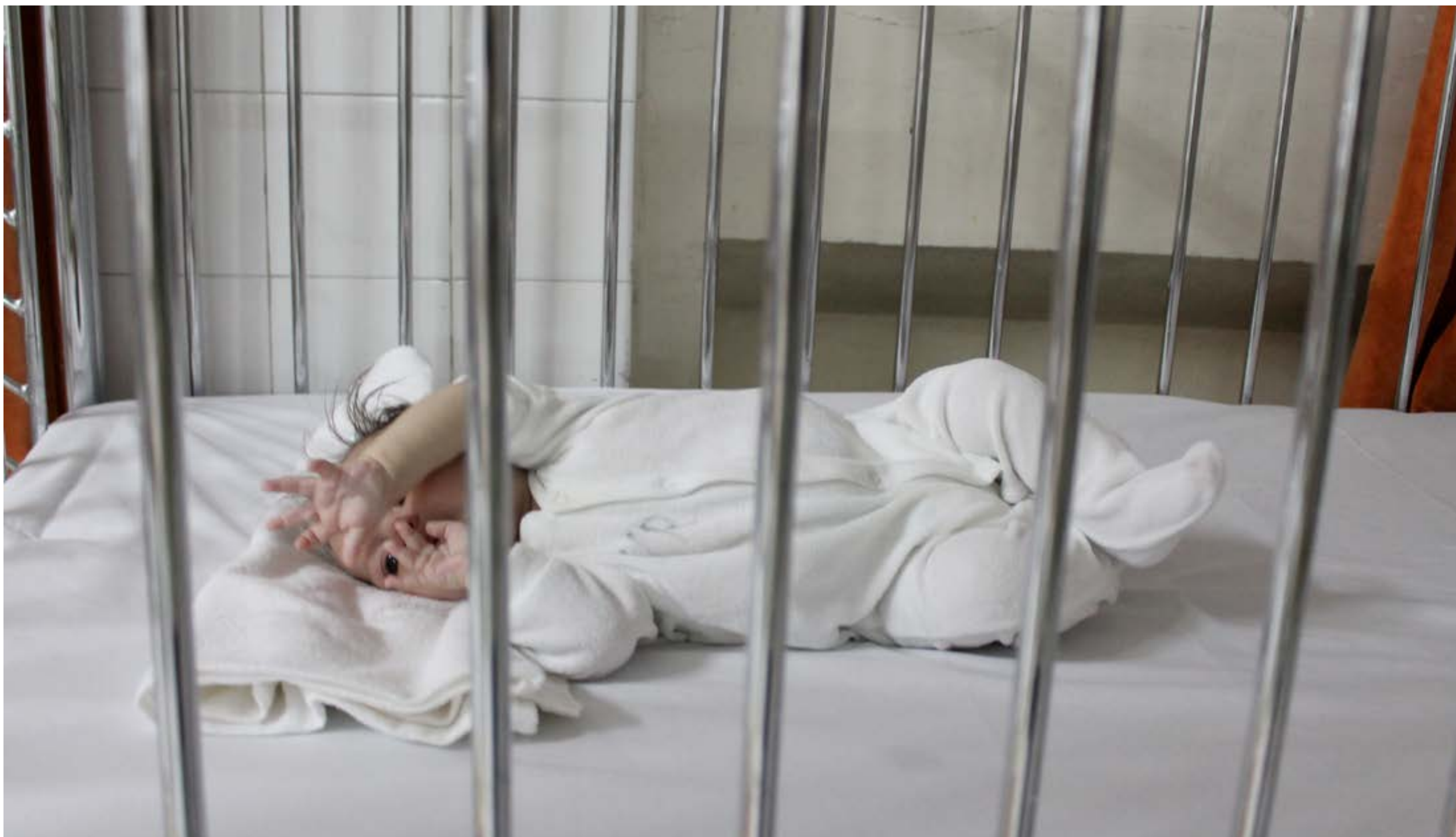
De små barnen är känsligare och blir lättare sjuka. Väl på sjukhuset riskerar de att inte hämtas av sina föräldrar som ofta är fattiga och upplever att barnet har det bättre på barnsjukhuset än hemma.