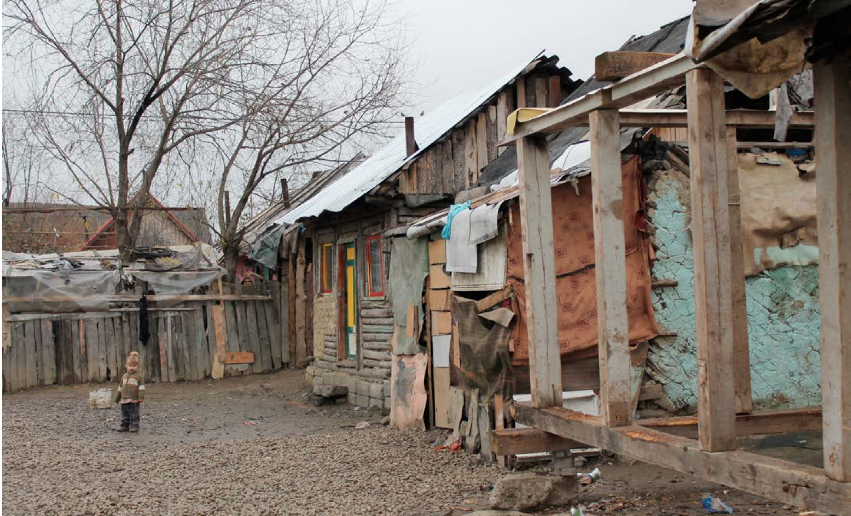
Ett av de slitna kvarteren i byn Budila. De som bor här har precis lagt ett lager med grov sten framför husen för att undvika den värsta lervällingen som höst och vintermånadernas väder innebär.