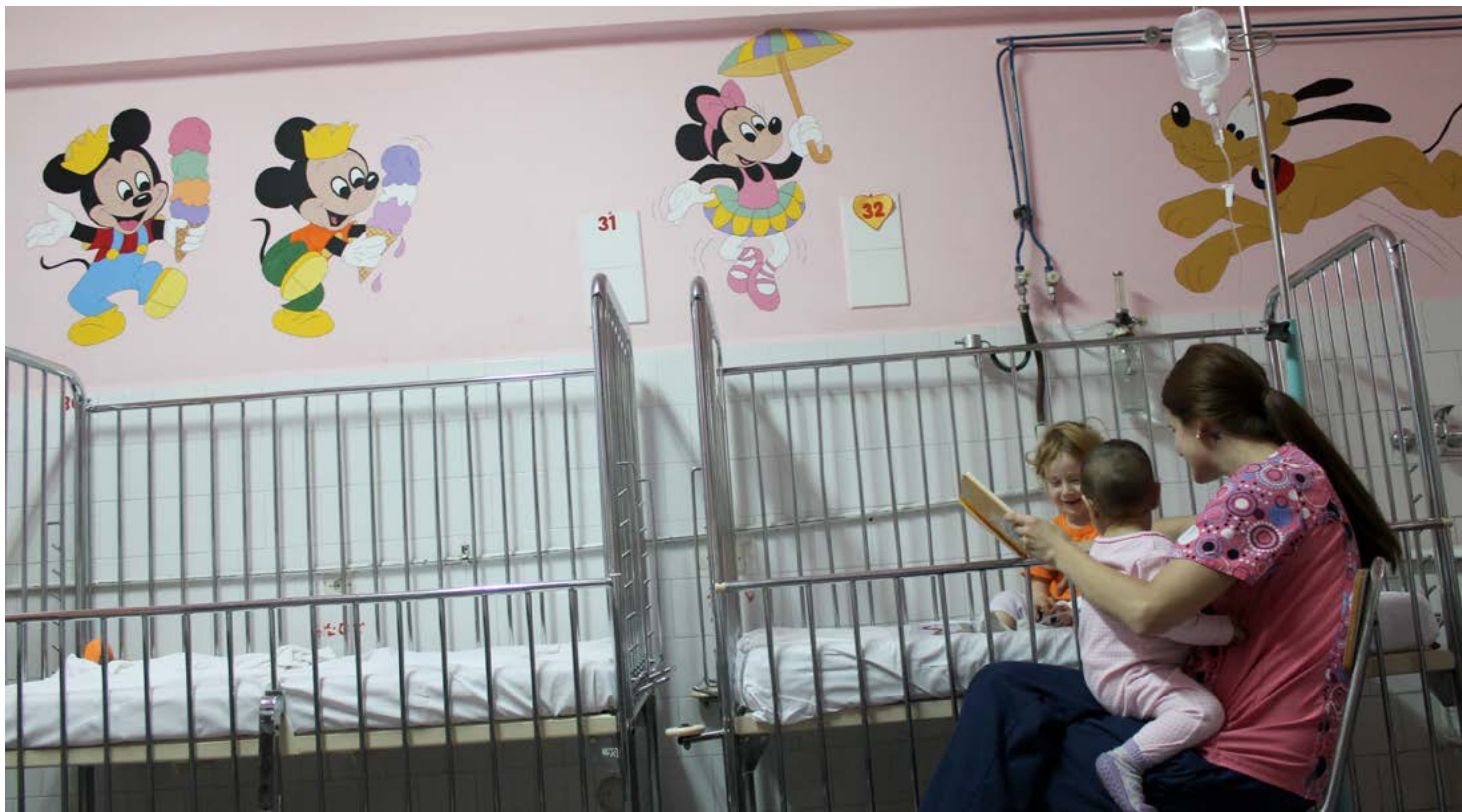
”När barnen först kommer in till sjukhuset är de ledsna, rädda att bli rörda vid, ler inte. Men efter ett par veckor gråter de när du går och inte när du rör vid dem. Och när du går och alla barnen i rummet